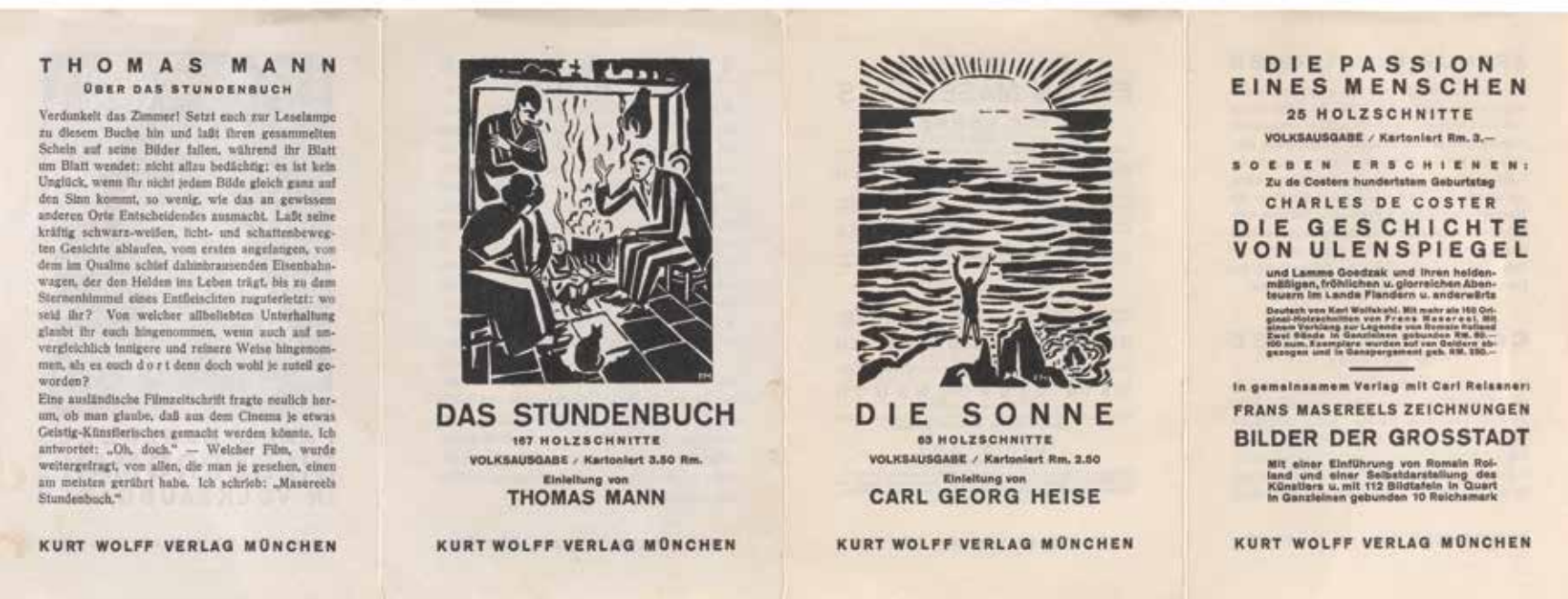
Frans Masereel, Das Stundenbuch , 1926

Het oeuvre van Masereel is gigantisch, bijna te vergelijken met Picasso. En dan werd een deel nog als ontaarde kunst vernietigd tijdens het Hitler-regime en bij de verwoesting van zijn vakantiehuis in Équihen bij Boulogne-sur-Mer in 1942. Masereel werkte snel, maakte vooral tekeningen en houtgravures en bleef tot het einde actief, met het interbellum als zijn meest vruchtbare periode.