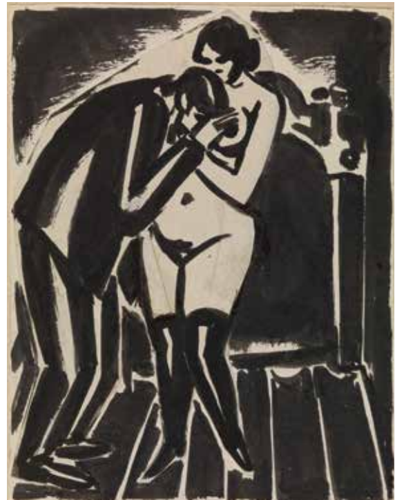
↓ → Frans Masereel, Mon livre d'heures (voorstudie), ca. 1918-1919, zwarte inkt op papier, Museum voor Schone Kunsten, Gent

Midden 1918 werd Masereel zoals miljoenen anderen getroffen door de Spaanse griep. Zijn herstel viel samen met het einde van de oorlog. Dat herwonen vitalisme legde hij vast in Mon livre d'heures . In 1917 had hij al het boek 25 images de la passion d'un homme gepubliceerd. Vertelde die eerste suite in houtgravures een kort en grimmig oorlogsverhaal, dan werd Mon livre d'heures een lange lofzang op het leven.