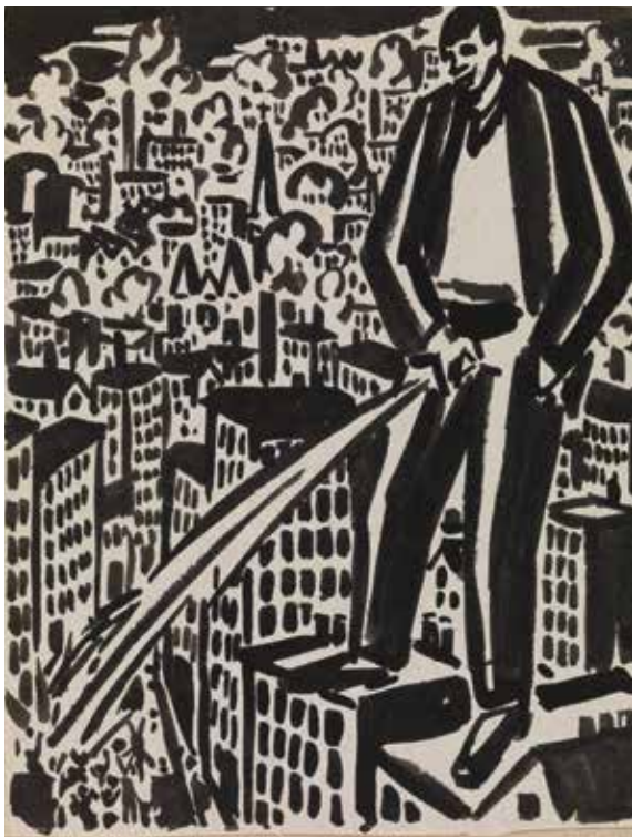
↑ → Frans Masereel, Mon livre d'heures (voorstudie), ca. 1918-1919, zwarte inkt op papier, Museum voor Schone Kunsten, Gent