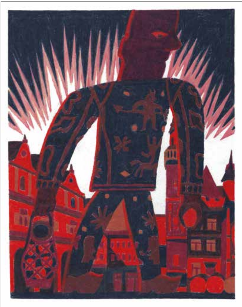
Lisa Ottenburgh, Februari , 2024, kleurpotlood, 21 x 17 cm