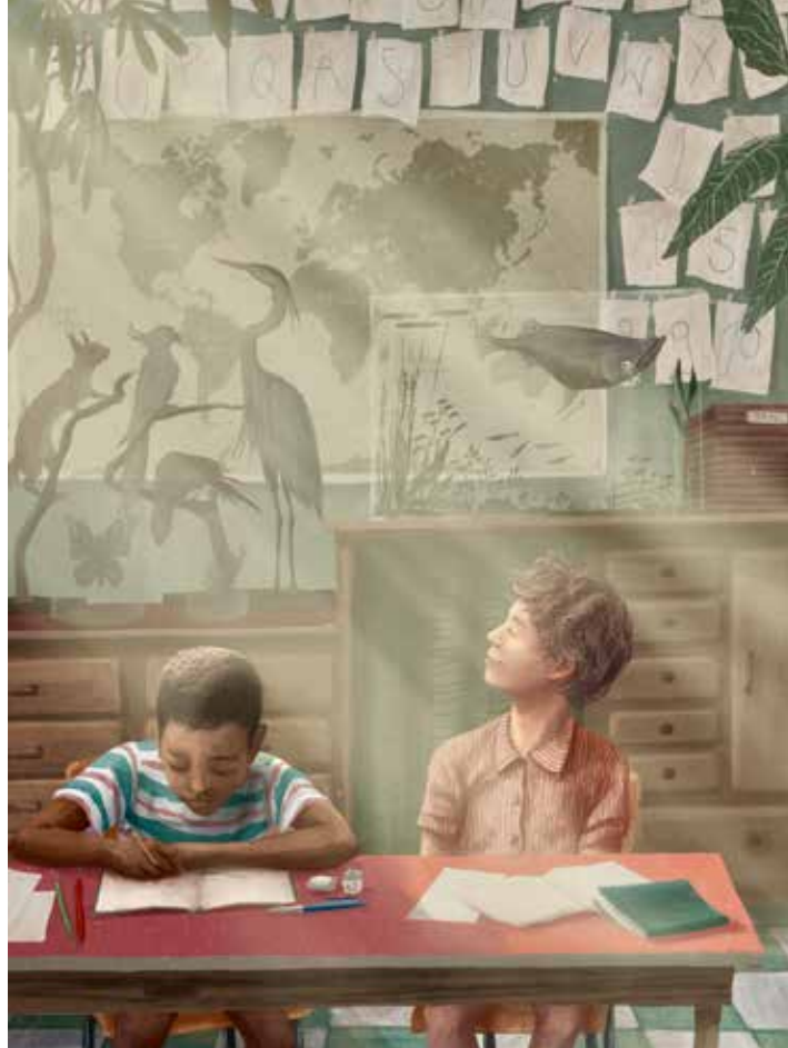
Stien Van Kerckhoven, Terug naar school , 2023, digitale illustratie, 21 x 29,7 cm

“Tegelijk wil ik de dingen die herkenbaar zijn niet verliezen. Ik moet het vertrouwen vinden dat mensen voor mijn stijl zullen