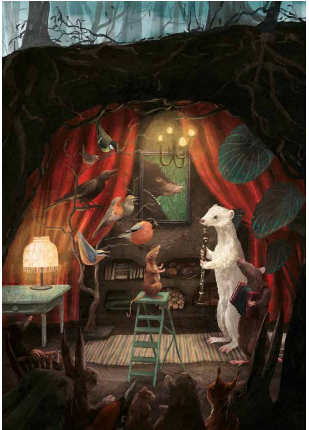
Stien Van Kerckhoven, Winter in het hol van de mol , 2023, digitale illustratie, 21 x 29,7 cm

“Ik moest aan eigen ervaringen denken, aan eigen emoties. Zodra ik daar ben, komt het beeld vanzelf.”