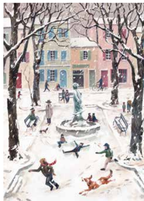
Stien Van Kerckhoven, Sneeuw in Saint-Rémy , 2023, acrylverf op papier, 29,7 x 42 cm