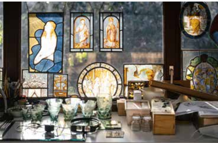
In het atelier van glasrestaurator Joost Caen