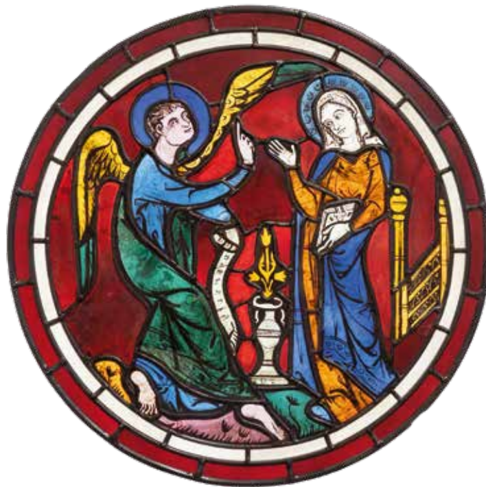
Anoniem (Parijs), Annunciatie , tweede helft dertiende eeuw, Museum Mayer Van den Bergh, Antwerpen

Zijn glasramen al fragiel, de schetsen die eraan voorafgingen, weerstaan doorgaans nog minder de tand des tijds. Het is een uitzonderlijke rijkdom dat we op de Topstukkenlijst een ensemble vinden van een medaillon met de voorstelling van de heiligen Maria Magdalena, Martha, Lazarus en Maximus die inschepen voor Marseille (het hele verhaal wordt uitgebreid verteld in de