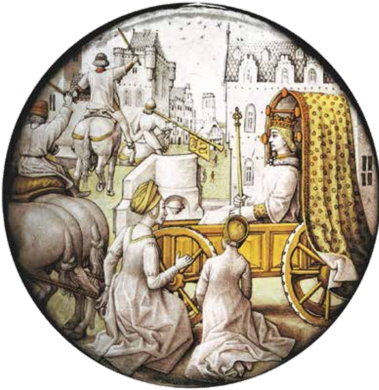
Meester van de Jozefreeks (omgeving Hugo van der Goes), Triomf van Jozef , ca. 1480, OCMW, Brugge

werkte met helder glas, dubbelzijdig grisaille en diverse tinten zilvergeel, maar ook met diepe kleuren in email.