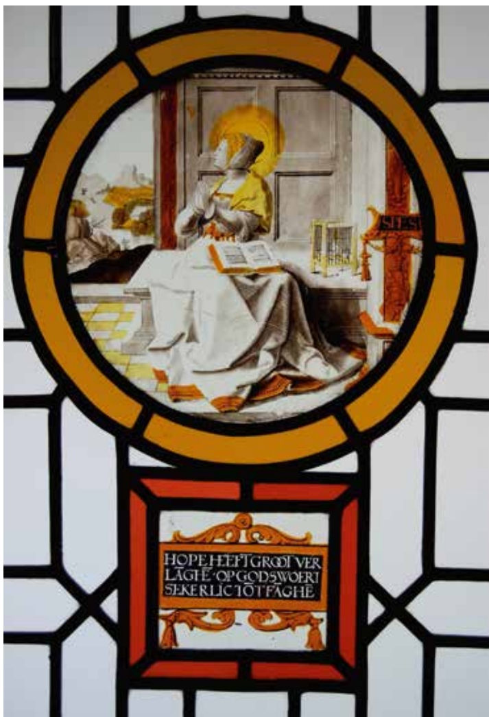
Anoniem (Antwerpen), Deugden en Bijbelse tafereelen , tweede kwart zestiende eeuw, Hof Van Liere, Antwerpen

Uit de zeventiende eeuw dateert een magnifiek ensemble van glasramen en schetsen door Jan de Caumont, de kunstenaar die in 1635 de opdracht binnenhaalde om 41 monumentale glasramen te ontwerpen voor de abdij van Park nabij Leuven. Ze verbeelden het leven van de heilige Norbertus, stichter van de orde van de norbertijnen waartoe de abdij behoorde. In de negentiende eeuw geraakte dit ensemble verspreid. Op dit ogenblik worden 198 afzonderlijke glaspanelen en 7 schetsen van Jan de Caumont in Leuven bewaard. Twintig glasramen zijn opnieuw te zien in de pandgang van de gerestaureerde abdij. De Caumont was een van de grootste glazeniers van de zeventiende eeuw en qua technieken haalde hij voor deze reeks alles uit de kast. Hij