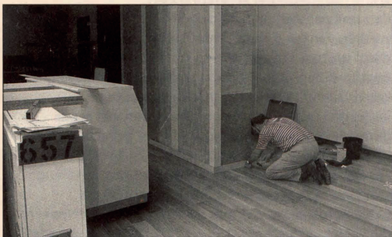
Enkele aspecten van de materiële voorbereiding van de tentoonstelling 'Hans Memling. Vijf eeuwen werkelijkheid en fictie' in het Groeningemuseum (12 augustus - 15 november 1994).

Voor een dergelijk opzet worden partners gezocht. Deze rol werd aanvaard door de provincie West-Vlaanderen, Toerisme Vlaanderen en de 'Vrienden van de stedelijke musea'. Zij leveren een grote bijdrage door het ter beschikking stellen van hun diensten. De 'Vrienden' bijvoorbeeld hebben sponsors gezocht en gevonden. Zij zorgen voor het budget 'publiciteit' en nemen ook de merchandising voor hun rekening.