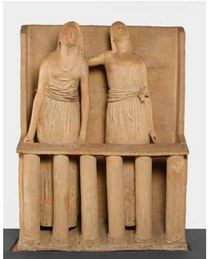
Arturo Martini, Chiaro di luna , 1931-1962 Middelheimmuseum, Antwerpen

Uit de periode 1945-1968 is Dubbele progressie in groen en wit (1969) van de Venezolaanse schilder en beeldhouwer Jesús Rafael Soto (1923-2005) een verrassende nieuwkomer binnen de topstukken. Het werk waarnaar we in familiekring altijd tederlachend verwezen als de 'satéstokjes van Cercle Brugge' wordt momenteel gerestaureerd en zal net als tachtig procent van de sculpturen binnenkort een nieuwe plek krijgen. Toen Soto het werk in 1969 in situ realiseerde ter gelegenheid van de tiende Middelheimbiënnale, was hij al lang geen onbekende meer voor