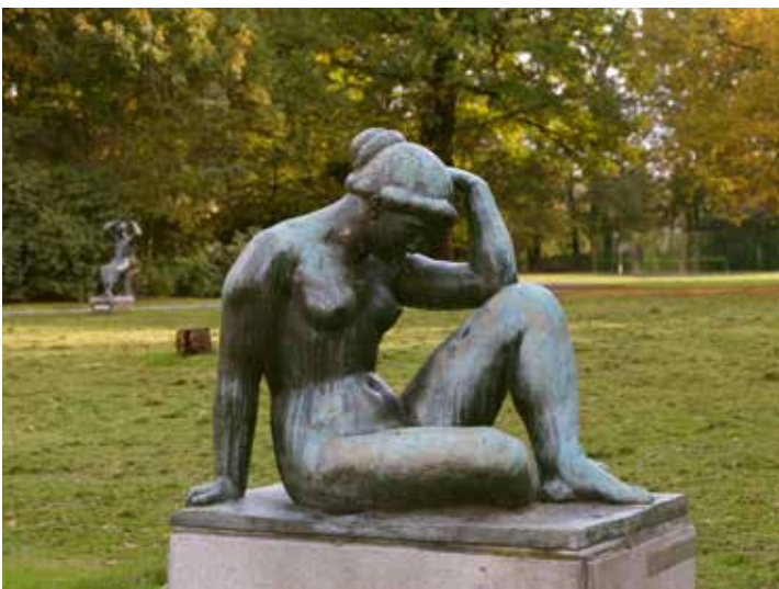
Aristide Maillol, De Middellandse Zee, 1902-1905 Middelheimmuseum, Antwerpen

Elk van de werken toelichten zou ons te ver leiden, daarom dat ik het me gepermitteerd heb om mijn persoonlijke selectie te maken.