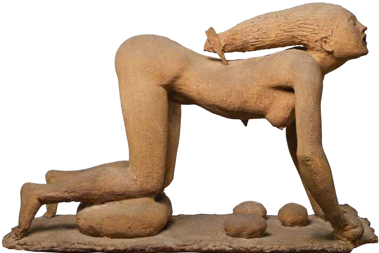
Arturo Martini, La lupa , 1930-1931 Middelheimmuseum, Antwerpen