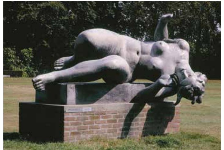
Aristide Maillol, De rivier , 1939-1943 Middelheimmuseum, Antwerpen

Dit werk kent een niet alledaags ontstaan. In 1940 is Maillol al twee jaar bezig aan De berg een beeld ter nagedachtenis aan de Franse schrijver en politicus Henri Barbusse (1873-1935). Plots blijkt dat de centen voor het werk op zijn. Maillol vraagt de rechten op zijn beeld terug en verzaagt het tot De rivier , de