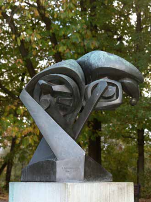
Raymond Duchamp-Villon, Het grote paard , 1914 Middelheimmuseum, Antwerpen