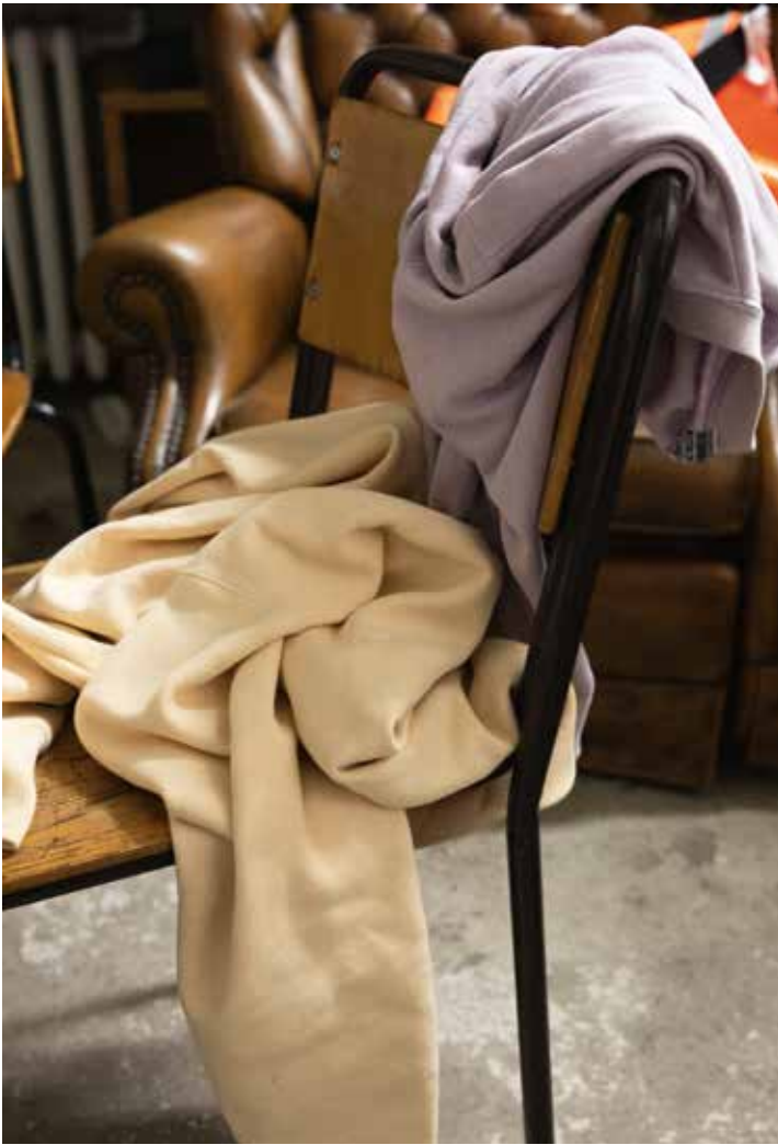
Wolfgang Tillmans, Faltenwurf 2019/1984, 2020 Collectie FOMU 2022/20