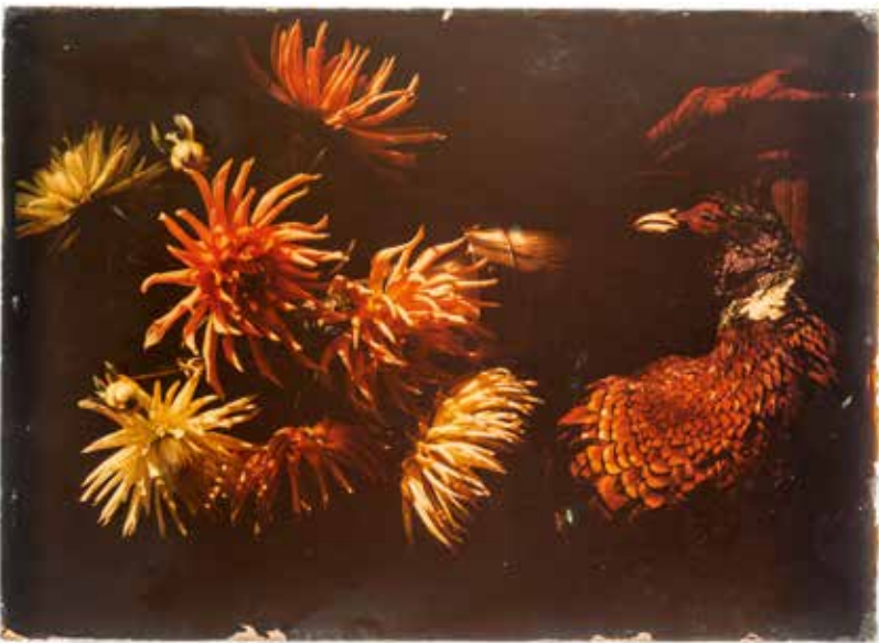
Charles Gaspar, Bloemen , ca. 1910 Collectie FOMU P/1971/255/2

om hun schoenen uit te trekken en in de tentoonstelling een ruimte voor rust, meditatie en vertraging te vinden. “De scenografische context en de meditatieve uitstraling van de ruimte zorgen ervoor dat je de dingen anders ziet. Alle aanwezige elementen, inclusief de kunstwerken, versterken bepaalde kenmerken in elkaar.” Gestimuleerd door de omgeving kunnen we anders (leren) kijken.