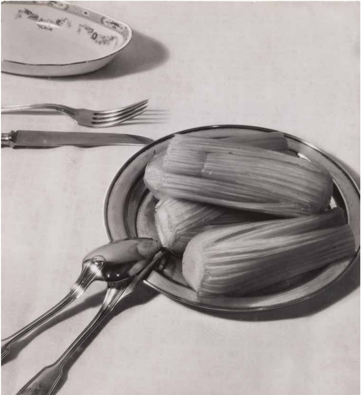
Albert Malevez, Tafel met bord voetselder , 1933 Collectie FOMU