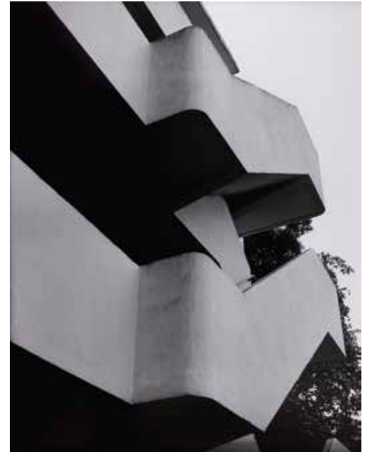
Grace Ndiritu, A Quest for Meaning: Painting as a Medium of Photography , 2014 Collectie FOMU / Collectie Vlaamse Gemeenschap BK/9433 © Grace Ndiritu 2023

aanwezig is in de omgeving. Dit werd vaak door vrouwen gedaan. Ursula K. Le Guin gaat in een artikel uit 1986 verder met deze theorie en legt verbanden met een vrouwelijke blik en een cyclische manier van denken: instinctief, associatief en relationeel.