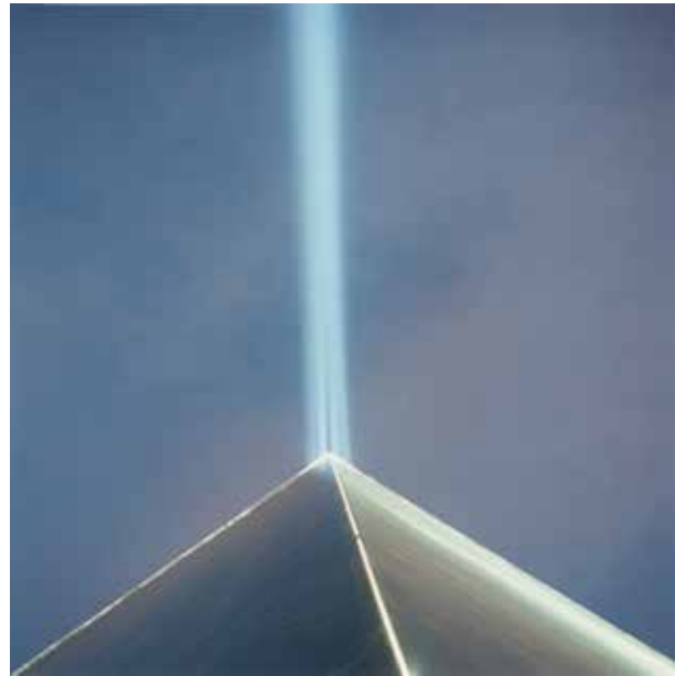
Rinko Kawauchi, Zonder titel , uit de reeks Illuminance , 2011 Collectie FOMU 2022/17

De uitnodiging van Ndiritu als externe en kritische blik op de FOMU-collectie is amper verrassend, want sinds 2012 voert Ndiritu onder de titel Healing the Museum een langlopend onderzoek rond het museum als instituut. "Als kunstenaar vind ik het belangrijk om kritisch naar instituten te kijken. Wat is de rol van een museum vandaag, in het artistieke veld en daarbuiten? Wat wordt en verzameld en waarom? Deze vragen spelen een centrale rol in mijn artistieke agenda en praktijk," vertelt ze. Healing the Museum wordt ook de titel van haar overzichtstentoonstelling in S.M.A.K. vanaf april 2023, die parallel loopt aan de expo in FOMU.