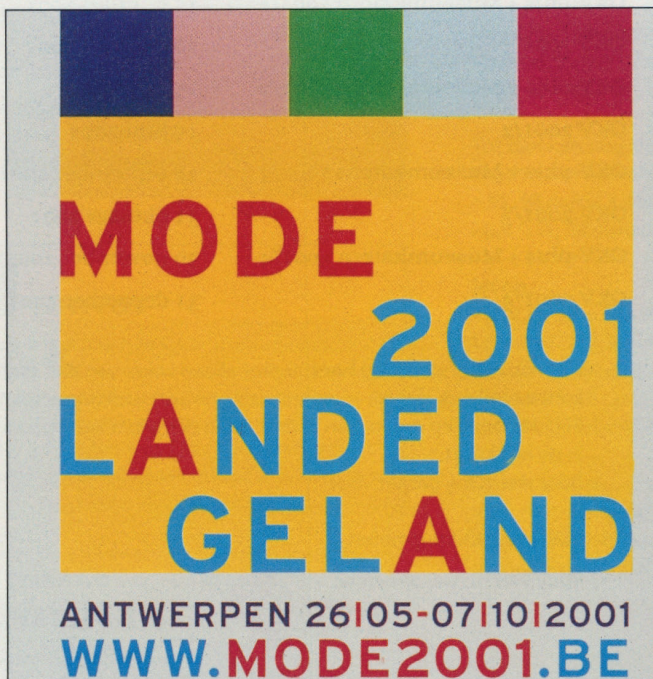
AFFICHE MODE 2001 FOTO: ANTWERPEN OPEN WALTER VAN BEIRENDONCK FOTO: ANTWERPEN OPEN

Museum voor hedendaagse kunst van Antwerpen Leuvenstraat 32 2000 Antwerpen Open van dinsdag tot donderdag en van zaterdag tot zondag van 10 tot 17 uur. Vrijdag van 10 tot 21 uur Gesloten op maandag Toegangsprijs: 250 BEF, 200 BEF (reductiehouders)