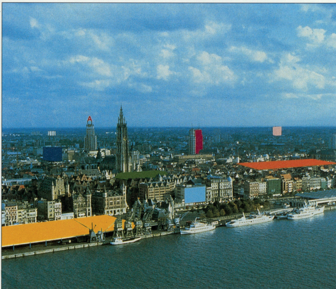
MODE 2001 LANDED/GELAND

Het is ook mogelijk een 'boarding card' aan te schaffen, waarmee u dan de 4 tentoonstellingen kunt bezoeken. De prijs van deze kaart is 605 BEF, voor reductiehouders 484 BEF.