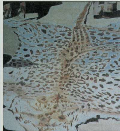
GEZICHT OP DE BIENNALE © STEF VAN BELLINGEN LUC TUYMANS LEOPARD, 2000 © ZENOX GALLERY, ANTWERP

Amarantaanbod voor OKV-abonnees Venetië: De Biennale van zaterdag 21 tot dinsdag 24 juli 2001 met Stef Van Bellingen