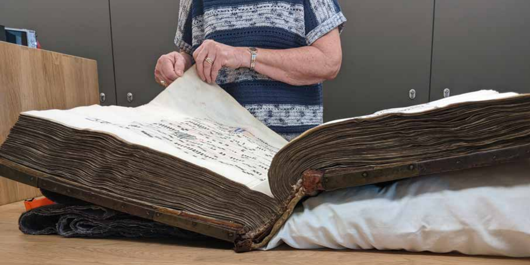
Het Antifonarium van Vorst : elk deel is bijzonder groot, 650 x 450 x 170 mm, en 35 kg zwaar Antifonarium van Vorst (volume 1), 1500-1502, publiek domein

Tegen einde 2023 zal meemoo meer dan 250 topstukken digitaliseren en toegankelijk maken. Van 175 objecten, vooral schilderijen, worden fotografische reproducties gemaakt. Een 25-tal topstukken wordt vastgelegd via gigapixelfotografie. Van elk van deze werken worden tot 200 hogeresolutie-opnames gemaakt en aan elkaar gehecht. Het eindresultaat is een bestand van minimum 1 miljard pixels. Voorbeelden van werken waar je tot op het kleinste detail zal kunnen inzoomen zijn het Altaarstuk van de heilige Rochus dat Peter Paul Rubens in 1623 schilderde voor de Sint-Martinuskerk in Aalst en het monumentale schilderij Bietenooft (1890) van Emile Claus in de collectie van het Museum van Deinze en de Leiestreek.