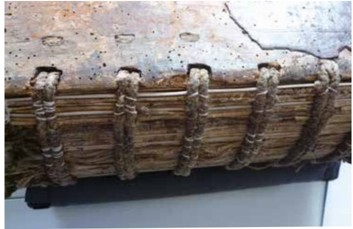
Het Antifonarium uit Basiliek van Onze-Lieve-Vrouw Geboorte in Tongeren heeft een zware en kwetsbare band, waardoor het moeilijk te manipuleren is Antifonarium , Onze-Lieve-Vrouwebasiliek Tongeren, OLV-BO-016, 15de eeuw, publiek domein

lijden onder inktvraat, een chemisch proces waarbij de inkt het papier of het perkament aantast, waardoor het manipuleren heel omzichtig dient te gebeuren. Ook het Beiaardboek (1746) van Joannes de Gruijters, bewaard in het Koninklijk Conservatorium Antwerpen, is aangetast door inktvraat en is ooit opnieuw ingebonden geweest, maar veel te strak zodat het nog maar moeilijk veilig kan geopend worden.