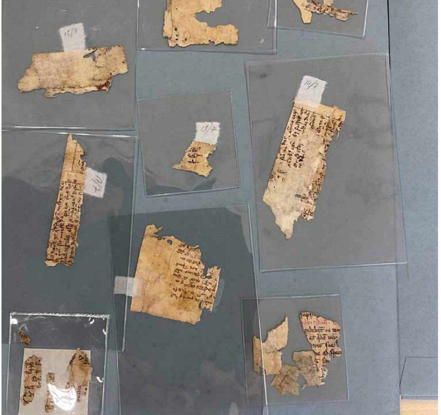
Een delicate opdracht: het digitaliseren van de minuscule Middelnederlandse fragmentjes Fragmenten uit de archiefreeks Stadsrekeningen, Stadsarchief Mechelen, serie I nrs. 3-7, 1385-1446, publiek domein