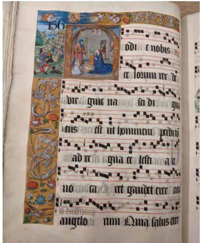
Het Antifonarium van Vorst bevindt zich in een prachtige ongeziene staat Antifonarium van Vorst (volume 1), 1500-1502, publiek domein

Voor de kwaliteitsvolle digitalisering van topstukken is meemoo de uitgelezen coördinator. Het heeft al heel wat ervaring met digitalisering, duurzame bewaring en digitaal beheer. Zo fotografeert meemoo verzamelingen van Vlaamse musea en erfgoedinstellingen, die het publiceert op de kunst- en erfgoedbeeldbank artinlanders.be. In 2020 ging het van start met GIVE, het Gecoördineerd Initiatief voor Vlaamse Erfgoeddigitalisering, dat onder andere de digitalisering van kranten en glasplaten omvat. Het Topstukkenproject maakt deel uit van GIVE.