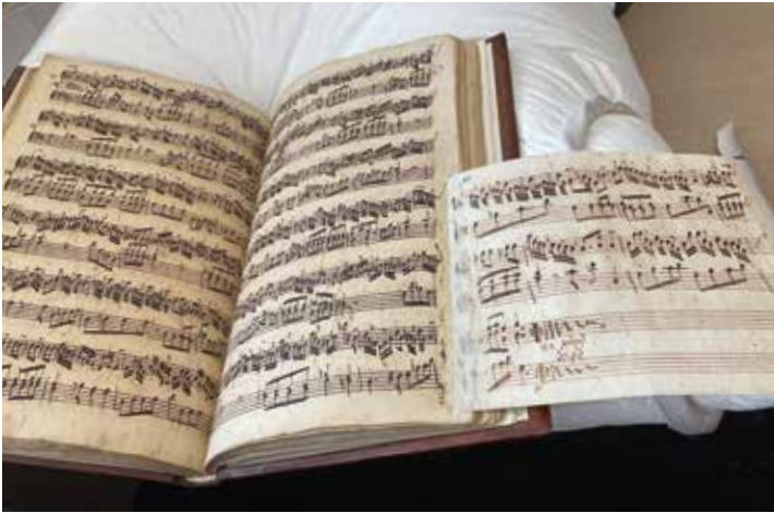
Het Beiaardboek (1746) van Joannes de Gruijters is ooit veel te strak opnieuw ingebonden Andanten, marchen, gavotte, ariën, giën, corenten, contre-dansen, allegros, preludies, menuetten, trion, & voor den beyaert ofte klok-spil bij een vergaert ende opgesteld , Bibliotheek Koninklijk Conservatorium Antwerpen, 17761, 1746, publiek domein

Het kwaliteitsvol en zorgzaam digitaliseren vereist voor elk topstuk een aanpak op maat. Enkele voorbeelden. Het handschrift Expositio Psalmorum uit het begin van de elfde eeuw, bewaard in de Abdij van Averbode, zal vooraf behandeld worden door een expert die plakband en andere oude herstellingen zal verwijderen. Ook de drie volumes met gregoriaanse handschriften uit de collectie van de Basiliek van Onze-Lieve-Vrouw Geboorte in Tongeren vragen elk bijzondere aandacht. Zo heeft het vijftiende-eeuwse Antifonarium een zware en kwetsbare band, wat het manipuleren bemoeilijkt. Bovendien is het perkament sterk vervormd zodat het niet eenvoudig is om dit te digitaliseren zonder glasplaat. Het veertiende-eeuwse Invitoriale heeft te