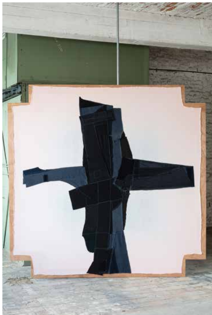
Leen Van Tichelen, cross tree H , 2022, een serie van 8, 248 x 243 cm