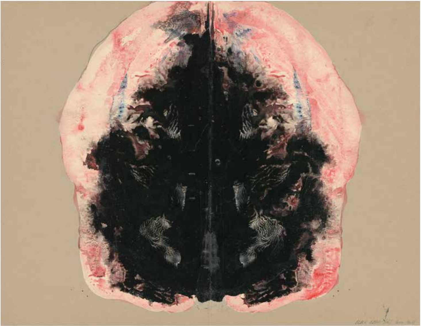
Leen Van Tichelen, BLACK BRAIN (16) , 2015, een serie van 27, 45 x 35 cm (ingelijst)