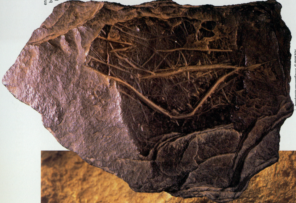
Ingekraste vrouwefiguur

Toch stellen we vast dat meer dan 90% van de afbeeldingen dieren betreffen en slechts 3% de mens. Is het niet veelbetekender dat binnen deze laatste groep afbeeldingen van mannen bijzonder zeldzaam zijn?