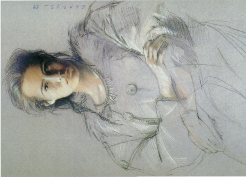
Reconstructie tekening, © Clarys

Om het geheel te duiden, brengt men eerst een inleiding rond de algemene tendensen binnen de 'kunst' tijdens het Paleolithicum en Mesolithicum. Vervolgens licht men de evolutie van de afbeeldingen van vrouwen in detail toe.