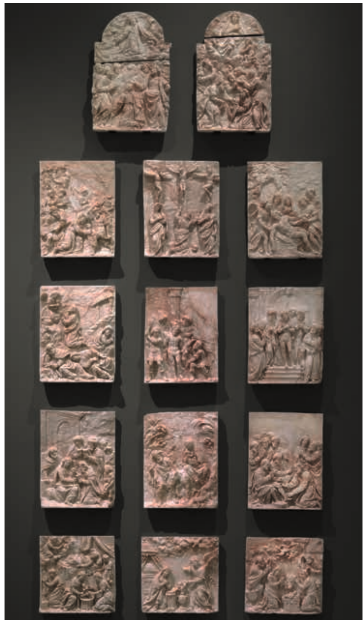
Robert Colyns de Nole II, Sint-Annaretabel , 1610, albast, M Leuven

ze ook populair bij de adel en de gegoede middenklasse. In de eerste helft van die eeuw was de werkplaats van de zogenaamde Meester van Rimini de meest indrukwekkende en invloedrijkste. Dit artistieke genie, omschreven als "de Jan van Eyck van de albastkunst", dankt zijn naam aan het monumentale en complexe Rimini-altaar. Waarschijnlijk was deze Meester actief in de Bourgondische Nederlanden, allicht in de omgeving van Brugge. Later, in de zestiende en zeventiende eeuw, zouden in de Zuidelijke Nederlanden op grote schaal albasten reliëfs en altaarstukken worden gesneden. Vooral Mechelen was tussen 1560 en 1630 beroemd voor de 'cleynstekers', die zich specialiseerden in kleine formaten, bijzonder geschikt voor privédevotie. De expo toont hiervan voorbeelden in de vorm van onder andere reliëfs, geïnspireerd op prenten, en huisaltaartjes.