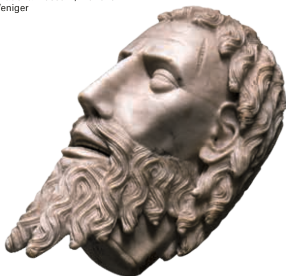
Omgeving van de meester van Rimini, Hoofd van Sint-Jan de Doper , ca. 1430, albast Bayerisches Nationalmuseum, München