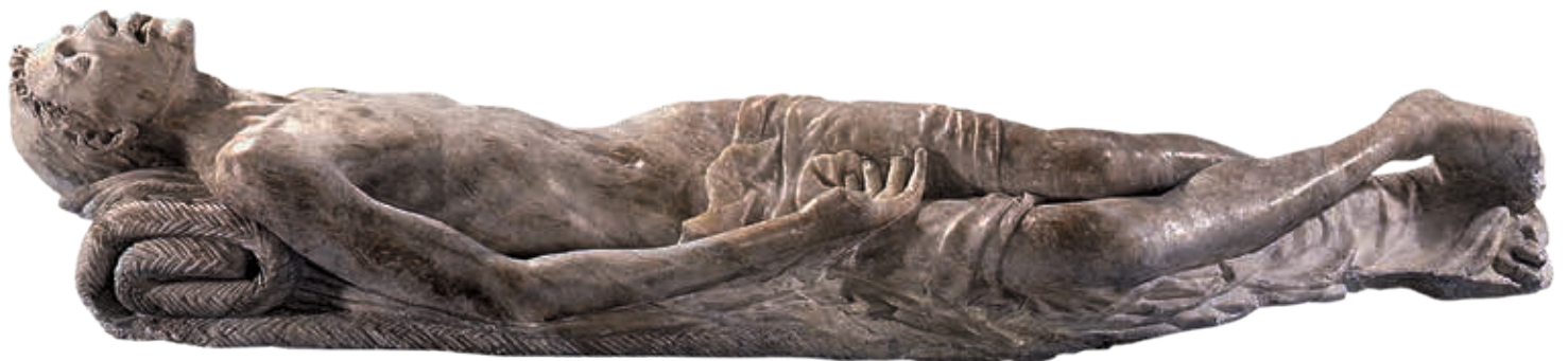
Transi van het grafmonument van Jean V de Hénin-Liétard (1499-1562), graaf van Boussu, ca. 1551-62, albast Eglise Saint Géry, Chapelle des Seigneurs, Boussu-lez-Mons

De hardheid van bepaalde houtsoorten, zoals eik, walnoot en buxus, is vergelijkbaar met die van albast, zodat dezelfde gereedschappen konden gebruikt worden voor snijwerk in al deze materialen. Sommige kunstenaars schakelden makkelijk over van de ene techniek naar de andere, niet alleen Conrad Meit, maar ook de Bormanfamilie en de vroeg zeventiende-eeuwse beeldhouwster Maria Faydherbe uit Mechelen.