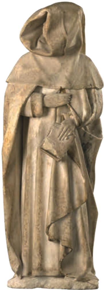
Etienne Bobillet en Paul Mosselmann, Pleurant met boek uit het grafmonument van Jean Duc de Berry, ca. 1451-53, albast Musée du Louvre, Parijs