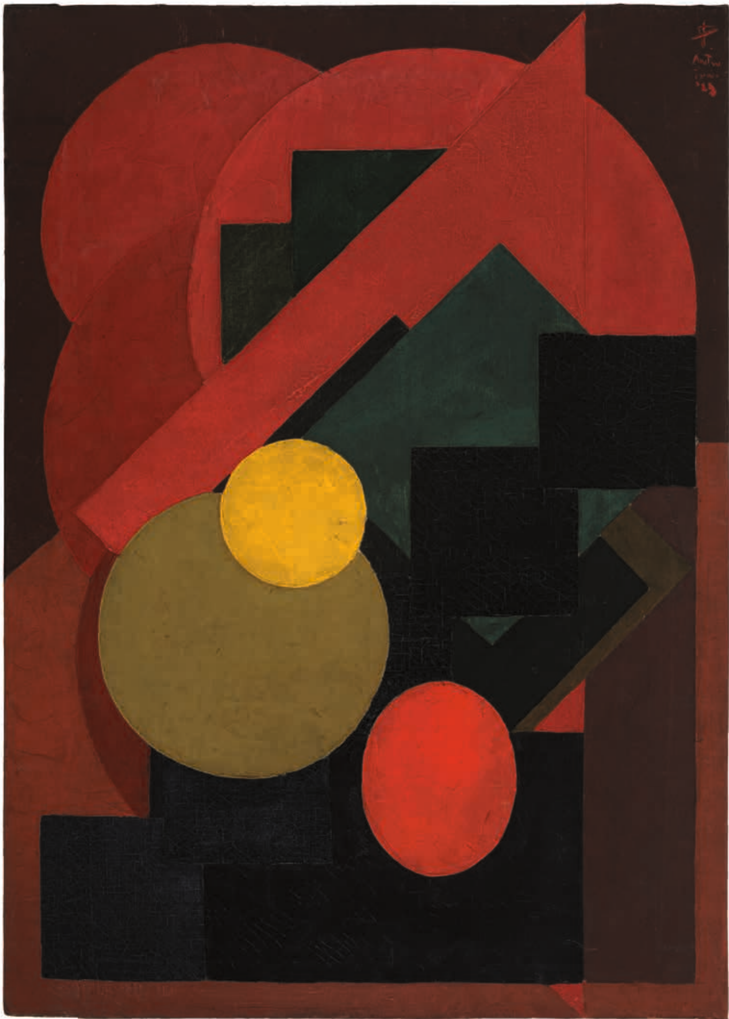
Jozef Peeters, Olieverfschildering 1 , 1923, olieverf op doek, 70,5 x 50,3 cm Galerie Ronny van de Velde, Antwerpen