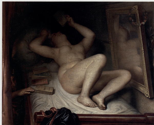
DE ROMANLEZERES