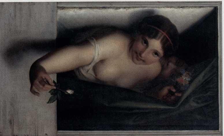
DE ROZENKNOP

Het meest opvallend in het museum is het waanzinnig grote atelier, met de waanzinnig grote werken erin. Toch zag Wiertz deze werken niet als een eindpunt, ze waren nog maar het 'voorwoord' van zijn oeuvre! Ze waren nog onvolkomen, zijn 'glorie onwaardig'. Op sommige van deze doeken is nog te zien hoe hij er later het woord 'ebauche' (ontwerp) op schilderde, en zelfs één keer 'mauvais' (slecht).