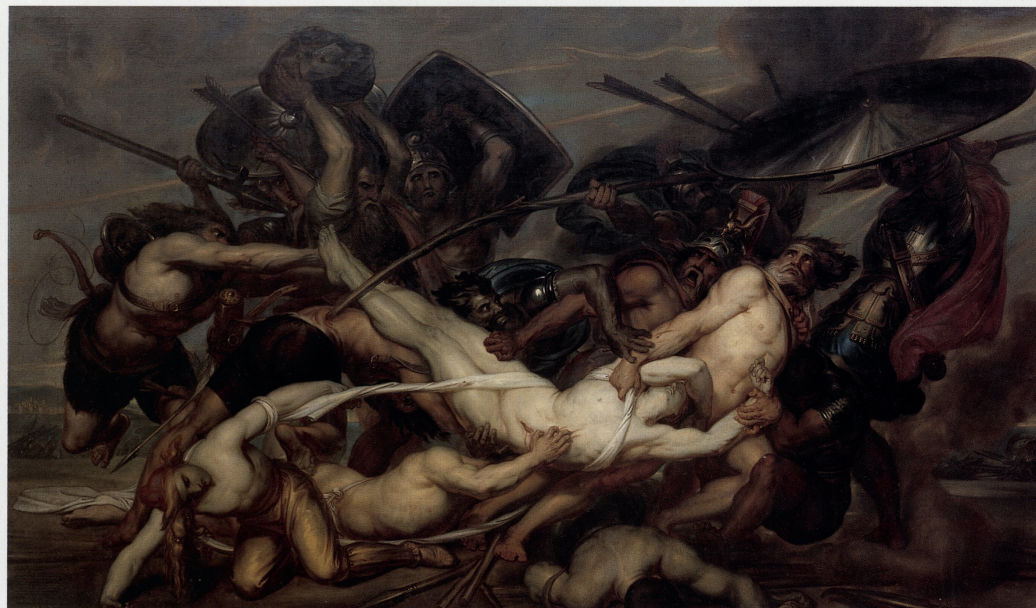
GRIEKEN EN TROJANEN VECHTEN OM HET LICHAAM VAN PATROCLUS