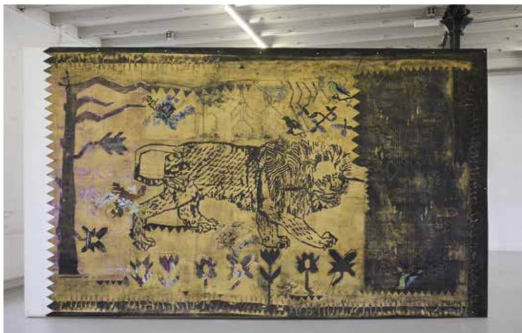
Arslan is een houtsnede van Caroline Coolen gebaseerd op een Turks patroon voor een tapijt Collectie Vlaams Parlement

draal), waarin hij vijf theaterteksten van Teirlinck samenbracht, geïllustreerd met een veertigtal houtsneden, tekeningen en kleine schilderijen. Het uitzonderlijke en nooit eerder getoonde kunstobject is vandaag nog altijd in familiebezit. Het staat centraal in de expo en wordt geflankeerd door Masereels zelden vertoonde werk uit de kunstcollectie van de provincie Limburg: één aquarel, vier schilderijen en drie houtsneden. MARK VANVAECK