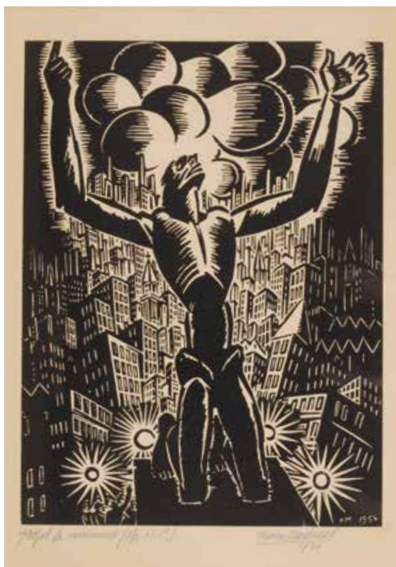
De stad was voor Frans Masereel een onuitputtelijke bron van inspiratie, zoals ook blijkt uit deze houtsnede Projet de monument uit 1954 Kunstcollectie provincie Limburg

draal), waarin hij vijf theaterteksten van Teirlinck samenbracht, geïllustreerd met een veertigtal houtsneden, tekeningen en kleine schilderijen. Het uitzonderlijke en nooit eerder getoonde kunstobject is vandaag nog altijd in familiebezit. Het staat centraal in de expo en wordt geflankeerd door Masereels zelden vertoonde werk uit de kunstcollectie van de provincie Limburg: één aquarel, vier schilderijen en drie houtsneden. MARK VANVAECK