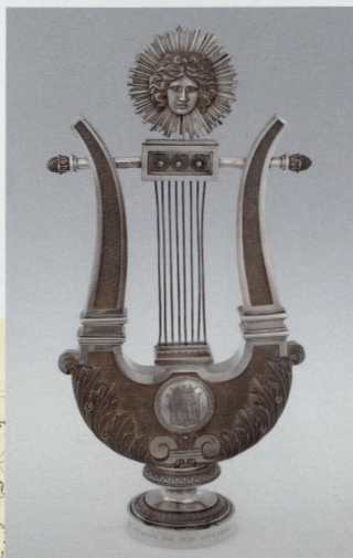
Zilveren lier 'Genootschap de Harmonie' van Antwerpen, Joseph Germain Dutalis, 1827