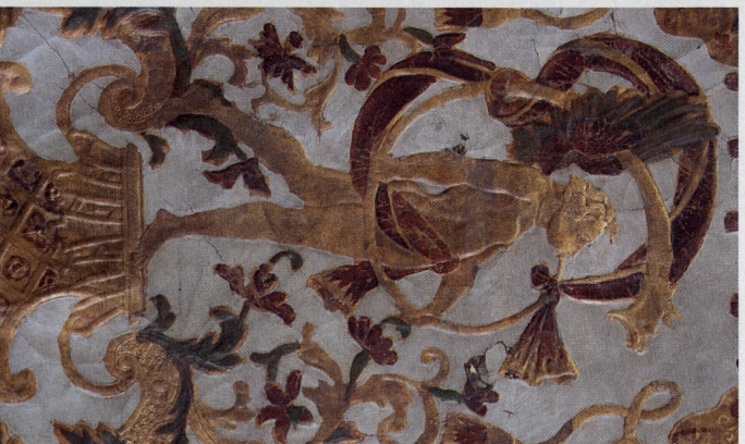
Schitterend Mechels gouldleer. Of is het zilver?

kunstbezit met gerichte aankopen, maar heeft ook oog voor vroegere tradities. Zo was Mechelen gedurende eeuwen een belangrijk centrum voor gouldleer. De hoofdconservator vertelt: "Tot de jaren 1990 stelde men het gouldleer tentoon in Museum De Zalm. Toen besloot het stadsbestuur het museum te sluiten omdat de verzameling niet meer 'toonbaar' was. Onwetendheid en gebrek aan respect voor dit specifieke erfgoed versnelden de aftakeling van het gouldleer. Men gebruikte bijvoorbeeld boenwas om het leder te reinigen, wat zeer nefast is. In 1993 startte de stad met een grootscheepse restauratiecampagne. Samen met het Koninklijk Instituut voor het Kunstpatrimonium behandelden we gedu-