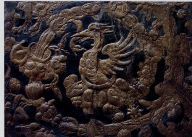
Mechelen was eeuwenlang een belangrijk centrum voor goudleer

Hans Bol: ongeëvenaard in miniatuurschilderen