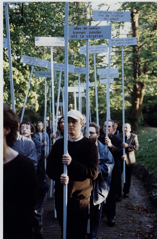
Toewijding (1999), aankomst der Processie