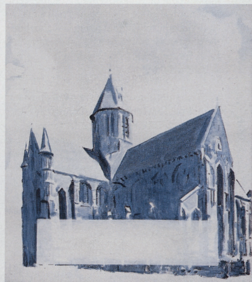
Team Spirit (1994), acryl op doek, 100 x 80