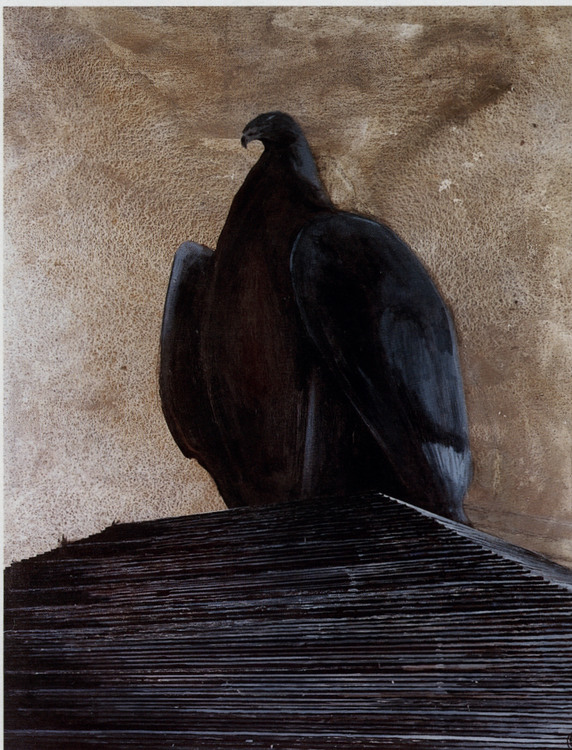
Bird of a nation (1988), acryl op doek, 200 x 160, uit de reeks 'Birth of a nation'

Voor een tentoonstelling in het Museum van Deinze en de Leiestreek kiest hij de titel Leeuwenhart: de wil van God . De tentoonstelling zelf wordt onderverdeeld in een aantal hoofdstukken. Het loont de moeite ze even te vermelden: 'Uit liefde voor de vlag' – 'Gemaskerd door het leven' – 'De dood komt ook zo wel' – 'De wil van God' – 'Het rijk der vrouw' .