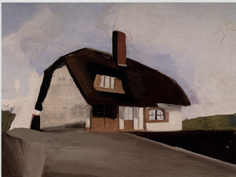
Een eigen huis (2000), olie op doek, 80 x 60, uit de reeks 'Wijzen van wonen'