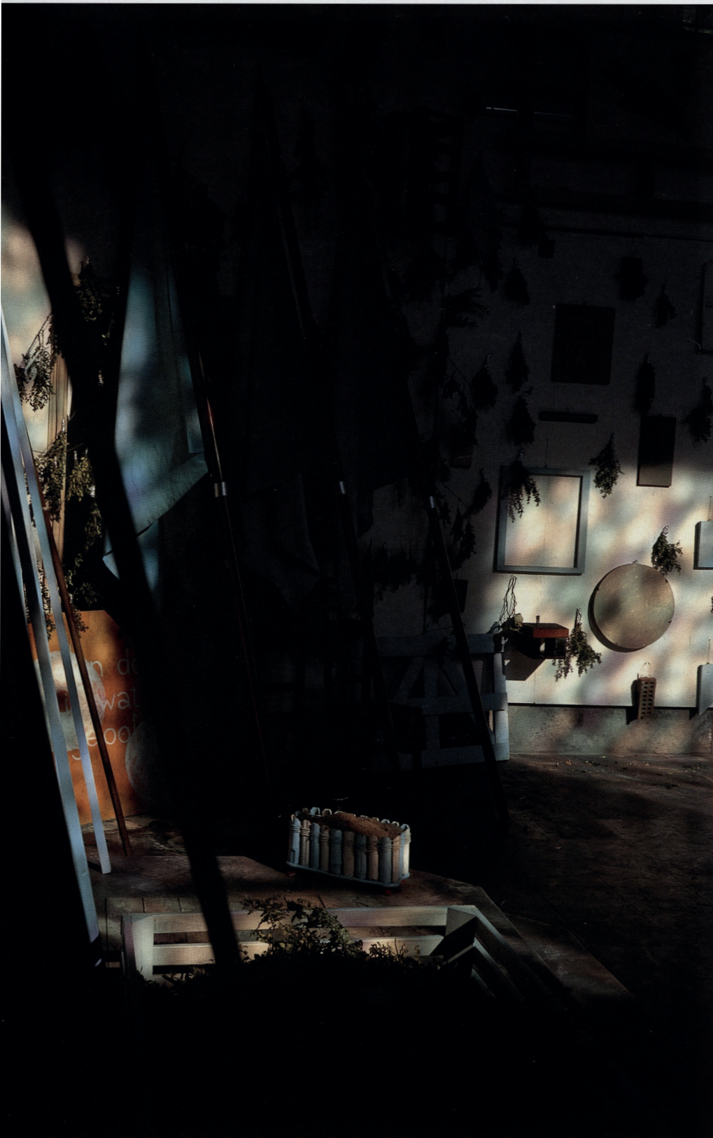
Toewijding (1999), gemengde techniek, Campo Santo kapel

in Kunst in België na 1945 ). Je kan de schilderijtjes bij wijlen uit het rek nemen en bekijken, erbij verwijlen. De kunstenaar zet je aan het denken.