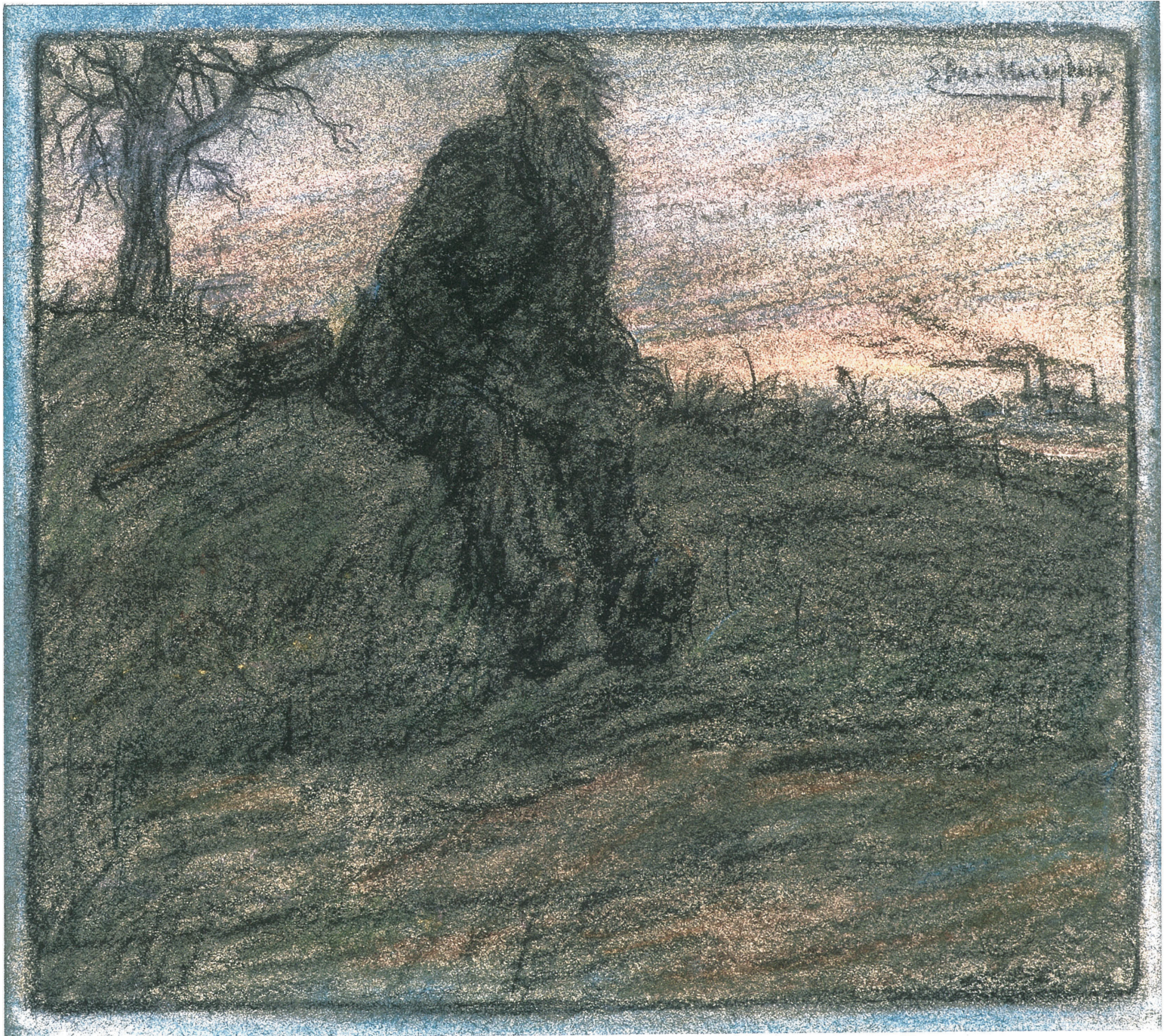
Eugène Van Mieghem, De Zwerper, 1894, pastel, 23 x 27 cm PRIVEÉRZAMELING