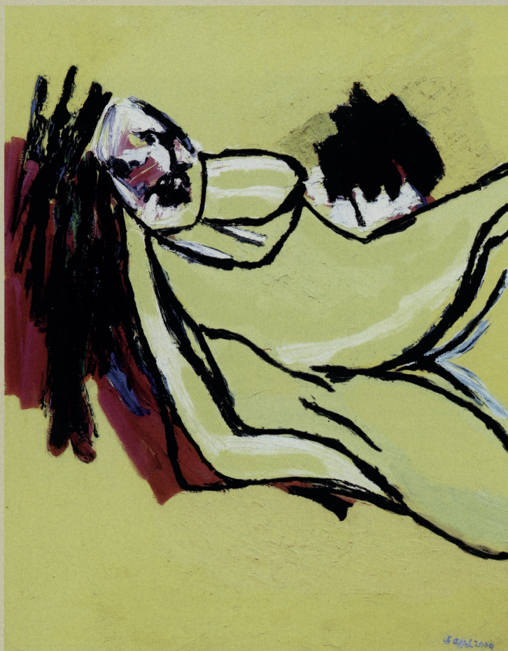
Karel Appel, Geel naakt, 2000, Verzameling Stedelijk Museum, Amsterdam © Karel Appel Foundation – Sabam Belgium 2004

En hoe zit het nu met de verschillen tussen Noord en Zuid? Rudi Fuchs vat het ooit kernachtig samen: "Nederlanders houden ervan dicht bij de concrete werkelijkheid te blijven, die hun iets geeft om zich aan vast te houden. Ze beteugelen hun verbeeldingskracht en 'verdiepen' zich vervolgens in wat ze gevonden hebben. Bij de Vlamingen liggen de dingen een beetje anders: in plaats van dicht bij de werkelijkheid te blijven, 'blijven ze dicht bij huis'. Daar thuis op hun eigen plek beleven ze verrukkelijke avonturen: melancholische, absurde, lyrische, weemoedige, surrealistische avonturen." (MV)