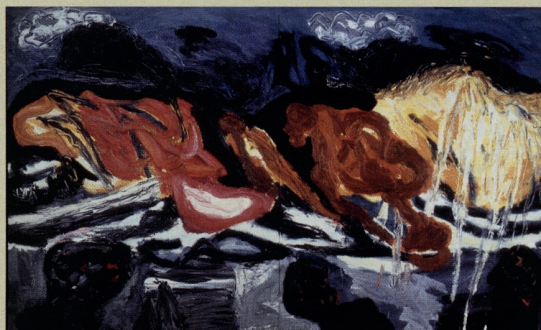
Karel Appel, De zondvloed, 1984

De tentoonstelling Onderweg neemt de bezoeker mee op een reis langs vijf eeuwen kunst uit de Noordelijke en Zuidelijke Nederlanden. Rode draad is het oeuvre van Karel Appel. De verschillen en verwantschappen tussen Vlaanderen en Nederland borstelen een breed panorama. Het experiment van CoBrA vormt het denkbeeldige oriëntatiepunt. Reisleider is