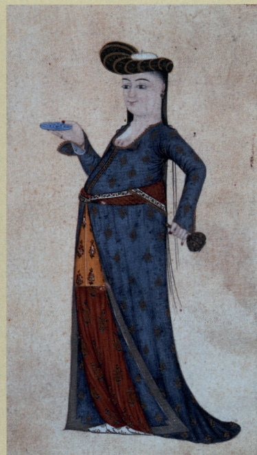
Frans School, Portret van een dame aan het hof, 17de eeuw, Istanbul, Rahmi Koc Collectie