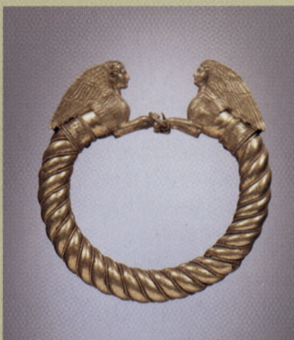
Armband met sfinxen (één van een paar), goud, brons, email, h. 11 cm, eerste helft 4de eeuw v.Ch., Staats Hermitage Museum, Sint-Petersburg

De Nederlanders hebben een neus voor zaken, ook voor kunstzaken. Toen het Staatsmuseum de Hermitage in Sint-Petersburg vijftien jaar geleden onderzocht of het satellieten in het Westen kon openen, waren onze noorderburen er als de kippen bij. In februari 2004 opende de eerste fase van de Hermitage Amsterdam in het gebouw Neerlandia aan de Nieuwe Herengracht. En eind 2007 zal het hele Amstelhof (ruim vierduizend vierkante meter tentoonstellingsruimte) in gebruik worden genomen. Nu al vinden in de zes zalen van Neerlandia kleine wisseltentoonstellingen plaats, afkomstig uit de rijke collectie van het Staats Hermitage Museum te Sint-Petersburg. Als opening is gekozen voor Grieks goud, een selectie uit de bekende schatkamers van het Russische museum. Een belangrijk onderdeel vormen de juwelen, daterend van de zesde tot de tweede eeuw voor Christus, uit de Griekse nederzettingen rond de Zwarte Zee. Ze werden door Russische archeologen tijdens opgravingen in de negentiende en twintigste eeuw gevonden. De armbanden, oorbellen, colliers en lauwerkransen zijn voorbeelden van fenomenale edelsmeedkunst. In de tentoonstelling zijn voorwerpen uit alle perioden en vindplaatsen te bewonderen, inclusief uit de beroemde tombes van Nympeum en Olbia. De verfijning van de sieraden is ongeëvenaard: details van kleding of gezichtsuitdrukkingen zijn soms nauwelijks met het blote oog waarneembaar. Op de tentoonstelling zijn ze met een loep zeer goed te bekijken.