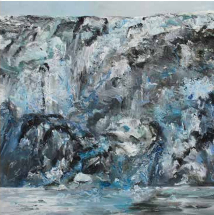
Anne Vanoutryve, Glacier Wall , 2020, olieverf op doek, 180 x 180 cm