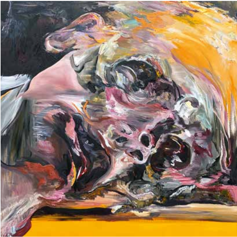
Anne Vanoutryve, Sam , 2022, olieverf op doek, 160 x 160 cm

“Mijn ouders hebben ons geleerd respect te hebben voor de natuur en ze spraken al over minder consumeren toen dat nog geen gemeengoed was.”