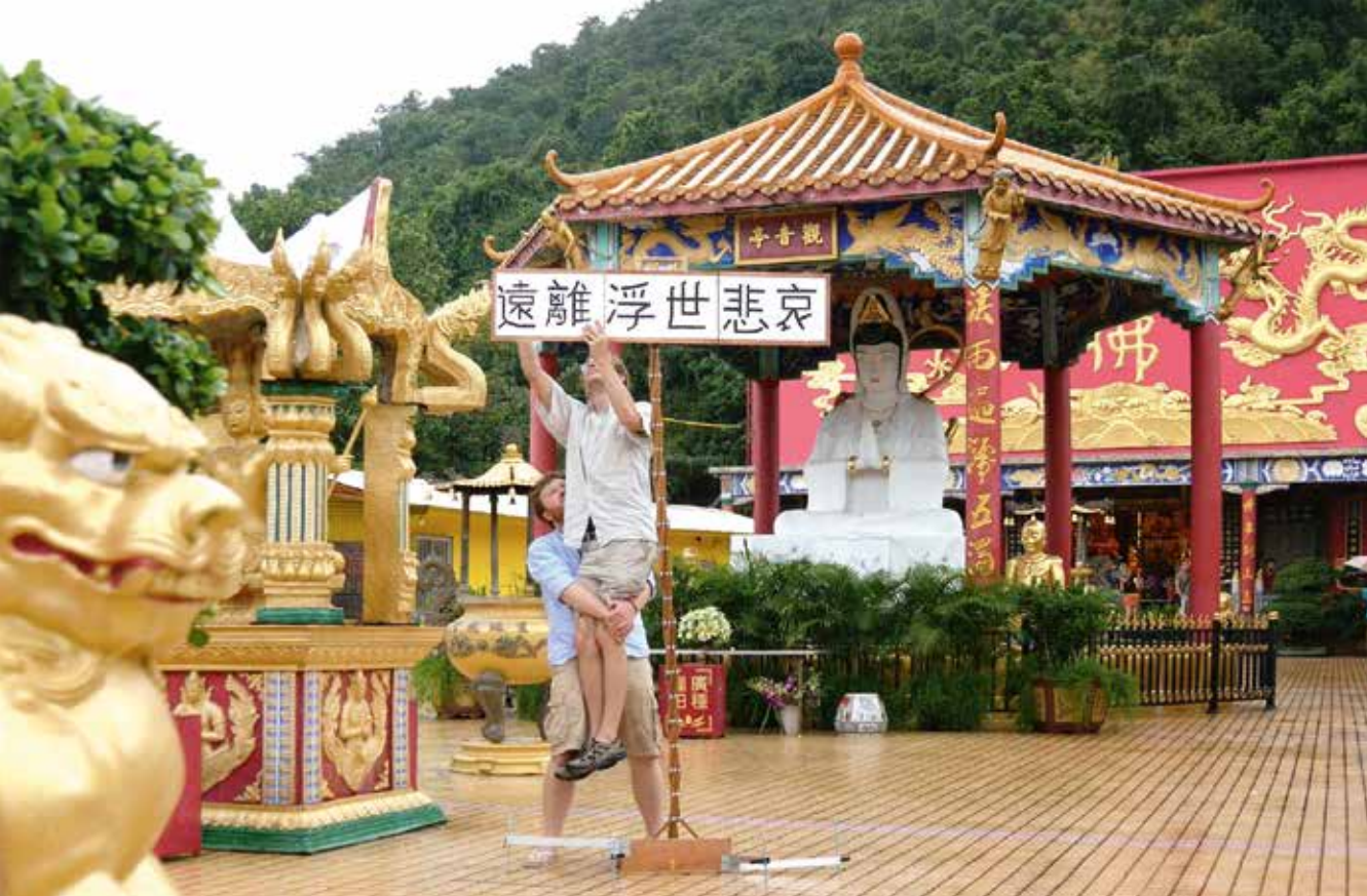
Robbert&Frank Frank&Robbert, performance postkaart nr 2, GO AWAY SORROW OF THE WORLD - Hong Kong, 2015

Het eerste werk dat ze als duo maakten, was De Kast in 2008 voor Kunstbende, een wedstrijd voor jong creatief talent die ze ook wonnen. "Op het podium stond een kast waar Frank uitstapte met een draagbare stereo en het nummer Ain't No Mountain High Enough van Diana Ross opzette. Er kwamen steeds andere mensen uit de kast. We gaven de deelnemers vooraf de instructie: "Kom uit de kast, het podium is van jou, doe er iets mee en ga terug op je plaats zitten in het publiek. Dat was de eerste aanzet om met performance en publieksparticipatie te werken. Nu ik erover nadenk: spelplezier en rekenen op de inbreng van de deelnemers, dat zoeken we ook met ons huidige VR-project op."