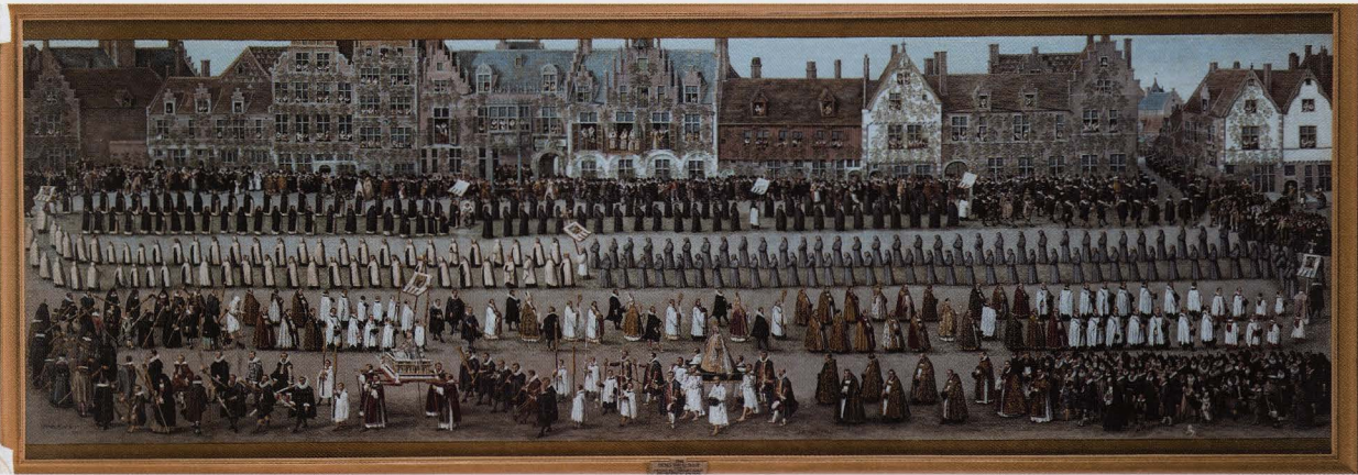
Denijs van Alsloot, De Brusselse omwegang van 1615. Processie op de Zavel, 1616, olieverf op doek MUSEO DEL PRADO, MADRID