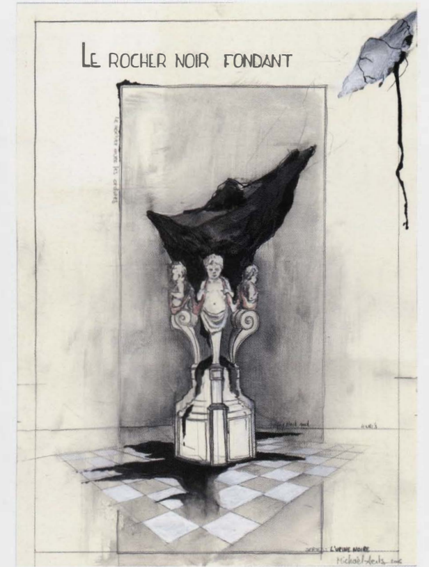
Opbouw van Le Rocher Noir Fondant

Ook hier worden weer vele relaties gelegd en zijn vele associaties mogelijk. Het gewoon noemen van de 'zwarte steen' laat onze gedachten toch onmiddellijk naar Mekka afdwalen? En Seahenge is een monument uit de prehistorie, in belangrijkheid te vergelijken met Stonehenge.