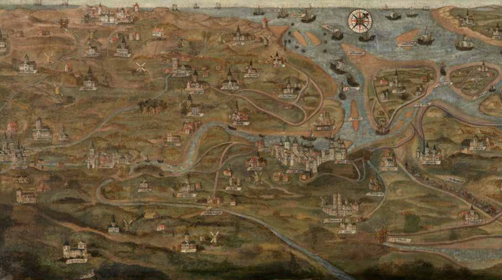
Jan de Hervy, Kaart van de Zwinstreek , 1501, olieverf op doek, 43,5 x 108,5 cm Groeningemuseum, Brugge

ze een groot succes. Uit de correspondentie van Mercator blijkt dat hij de productie nauwelijks kon bijhouden. Het globepaar op de Topstukkenlijst werd in 1881 aangekocht door de Koninklijke Oudheidkundige Kring van het Waasland en samen zijn ze de pronkstukken van het Mercatormuseum in Sint-Niklaas. Het gaat immers om originele Mercatorglobes en het zijn de enige gemonteerde exemplaren die in ons land bewaard zijn.