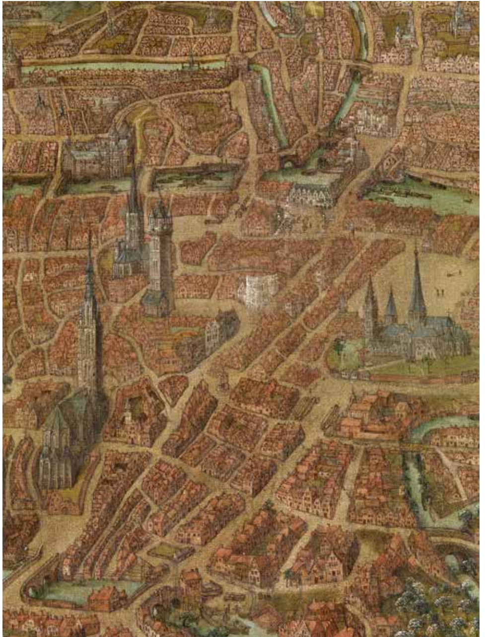
Anoniem, Panoramisch gezicht op Gent (detail) , 1534, olieverf op doek, 134 x 170 cm STAM, Gent

structuur zoals de net voltooide stadsomwalling, het stadhuis, de nieuwe beurs, het Hessenhuis en de Nieuwstad met het Hanzehuis. De stad presenteert zich ook als het meest moderne militair bolwerk van de Nederlanden. Voor de geschiedenis van Antwerpen in de zestiende eeuw is het plan van onschatbaar belang.