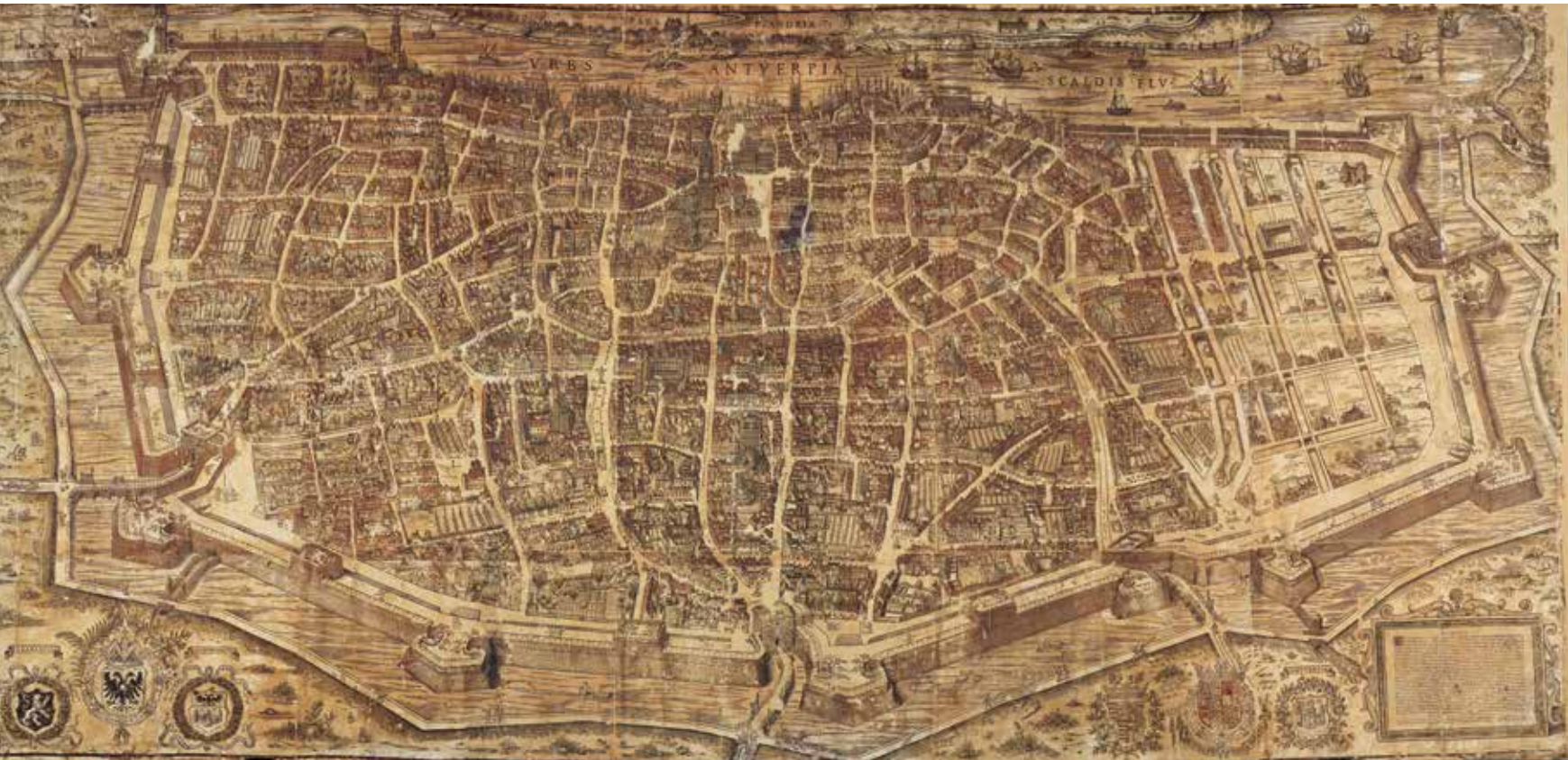
Virgilius Bononiensis, Urbs Antverpia , 1565, ingekleurde houtsnede, 1.200 x 2.650 mm Museum Plantin-Moretus (collectie Prentenkabinet), Antwerpen - UNESCO, Werelderfgoed

Bononiensis tekende Antwerpen vanuit het oosten in vogelvlucht. Dit was een totaal nieuwe oriëntatie aangezien de stad voorheen altijd weergegeven werd vanuit het westen. De Italiaan toont Antwerpen op het hoogtepunt van haar economische macht in 1565. Hier is een internationale handelsmetropool in kaart gebracht. Daarvan getuigen de gebouwen en de infra-