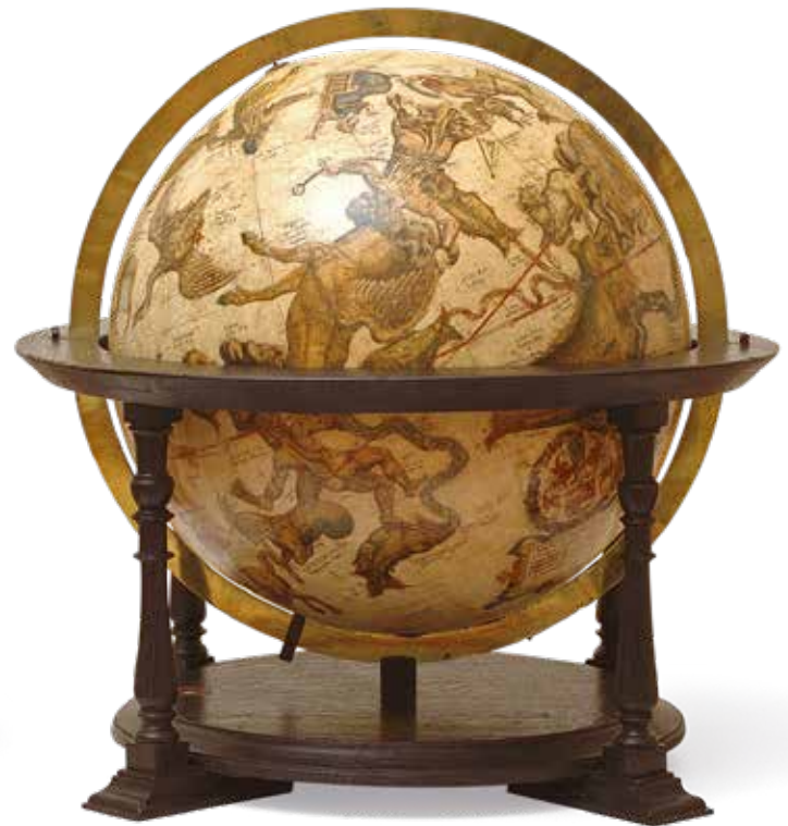
Gerard Mercator, Aardglobe , 1541, en Hemelglobe , 1551 Koninklijke Oudheidkundige Kring van het Waasland

rect beeld geeft van Brugge in 1562. De gravure van de tekening kende een groot succes. Tot in 1830-1840 werden drukken naar de oorspronkelijke kaart gemaakt.