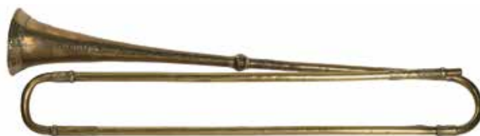
Gorgen Choquet, heraultstrompet in es, 1582 Musea Brugge

Niet alleen muzikale, maar ook liturgische evoluties zijn terug te vinden in de Topstukken. Een illustratief voorbeeld vormt de collectie gregoriaanse handschriften van de Onze-Lieve-Vrouwebasiliek in Tongeren (1389-1450). De gezangen getuigen van de ingrijpende liturgische hervorming van Radulphus de Rivo, die in 1371 aangesteld werd als deken en die zich liet inspireren door de Moderne Devotie.