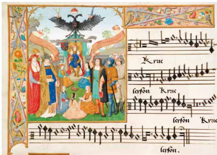
Koorboek van Margaretha van Oostenrijk ; 1515-1516, perkament, 66 x 44,45 cm, openingspagina met een politiek-allegorische miniatuur van de jonge aartshertog Karel (de latere keizer Karel) op de troon

De schatkamer van de Onze-Lieve-Vrouw-Geboortebasiliek in Tongeren bewaart eveneens een evangelieboek (ca. 1300) dat zowel kunsthistorische als muzikaal bijzonder belangrijk is. Het evangelarium bevat een dertiende-eeuws polyfoon fragment, het oudst bewaarde voorbeeld van polyfonie in de Lage Landen. Enkele toevallige vondsten hebben veel weerklank gekregen. In 1989 werd in het stadsarchief van Tongeren een aantal folia ontdekt die dienst deden als omslag voor een stapeltje rekeningen. Onderzoek bracht aan het licht dat het gaat om laat vijftiende-eeuwse fragmenten met polyfone muzieknotatie. Ze bevatten zes unica, liederen die nergens anders van bekend zijn. De fragmenten vallen op door het vroege gebruik van maatstrepen.