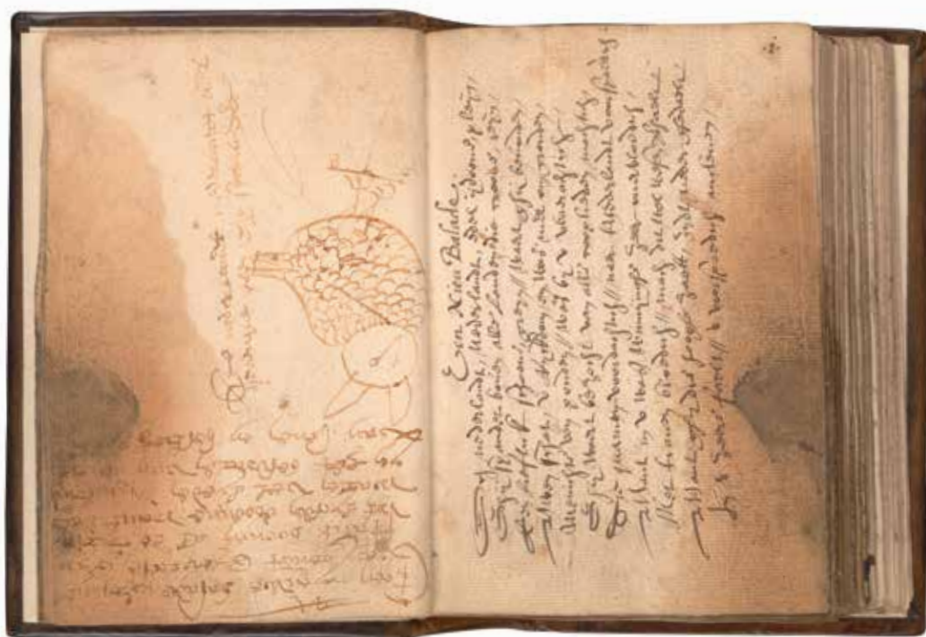
Politieke en religieuze balladen en refreinen, 1578-1584, f 1r Universiteitsbibliotheek Gent, BHSL-HS-0583