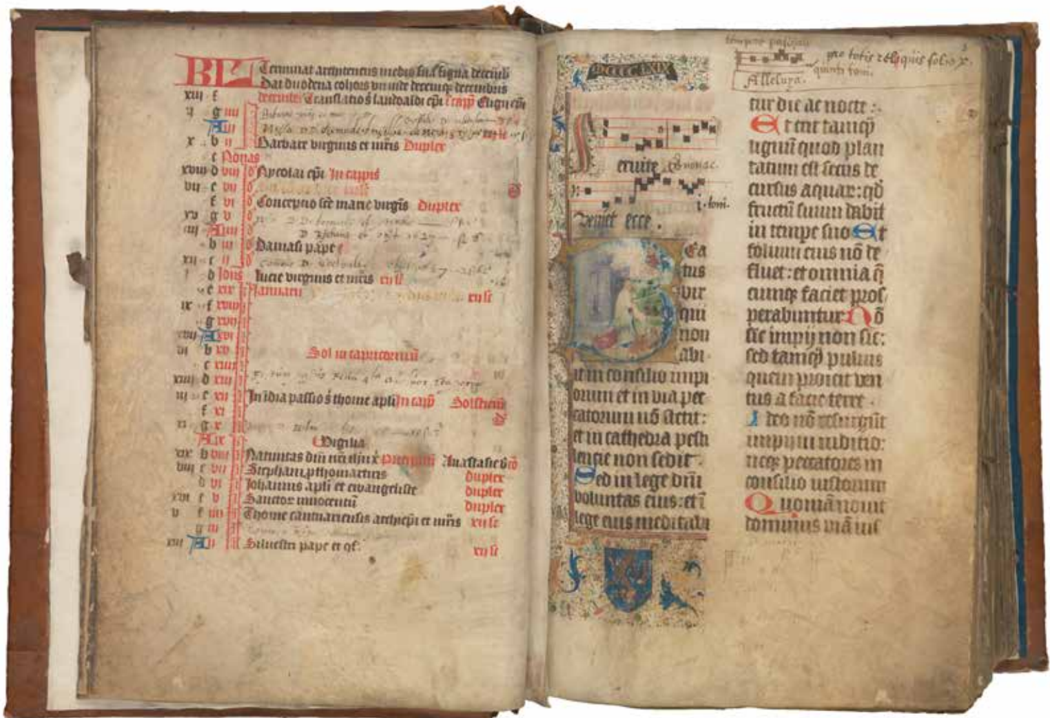
Breviarium van de Sint-Baafsabdij in Gent, ca. 1469, handschrift, f. 7v-8r Universiteitsbibliotheek Gent, BHSL.HS 0073