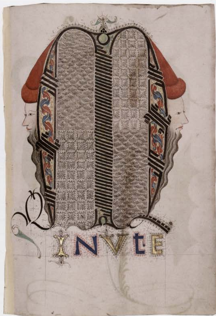
Brussel, KBR, ms. 9249-50, Miroir de la Salvation Humaine [in de Franse vertaling van Jean Miélot], f. 1r. Initiaal M

esthetisch vlak de toon aan. Verluchters uit de Zuidelijke Nederlanden konden – naast de leden van het Bourgondische hof – ook op een ander type van cliënteel rekenen. Een overgrote meerderheid van verluchte handschriften ontstond niet vanuit een hertogelijke opdracht. Heel wat miniaturisten werkten voor mensen die om verschillende redenen en voor een heel gevarieerd gebruik een verlucht handschrift wilden aanschaffen. De markt had dus veel meer te bieden dan alleen de luxeboeken volgens de Bourgondische mode.