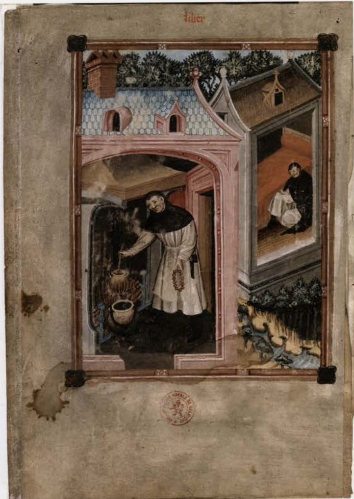
Brussel, KBR, ms. II 138, Jan van Leeuwen, Vanden tien gheboden Gods en Vanden drien coninghen (fragmenten), f. 2r. Jan van Leeuwen in zijn keuken en schrijvend in zijn kloostercel