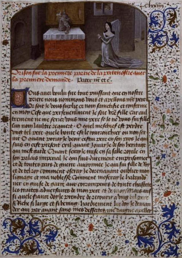
Brussel, KBR, ms. 9272-76, Verzameling ascetische traktaten, f. 182r. Vrouw (schenkster ?) in gebed geknield voor een beeld van de Heilige Drievuldigheid