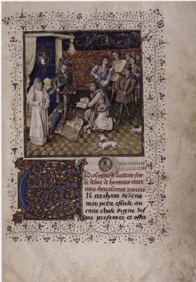
Brussel, KBR, ms. 9278-80, Lucianus van Samosata, Débat d'honneur [in de Franse bewerking van de Latijnse vertaling van de Griekse tekst]; Buonaccorso da Montemagno da Pistoia, Controverfia de nobilitate [in de Franse vertaling: Débat de vraie noblesse] ; Faits et miracles de saint Thomas, f. 1r. Jean Miélot biedt zijn werk aan Filips de Goede aan.