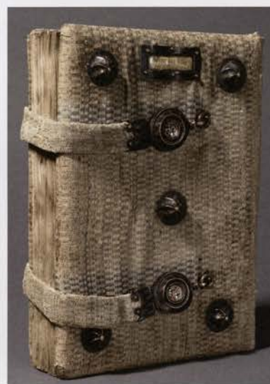
Brussel, KBR, ms. II 280. Boekband met het wapen van Lodewijk van Gruuthuse.