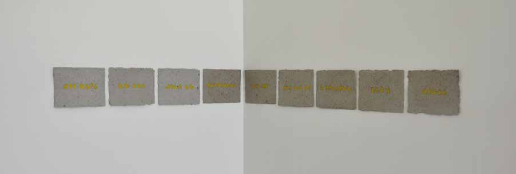
Nel Bonte, TYPEFACE-paper , variabele dimensie, elandpapier met aquarel, residentie Finland