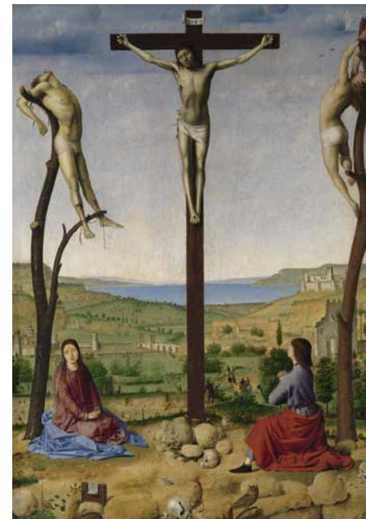
Antonello da Messina, Kruisiging , 1475, olieverf op paneel, 59,7 x 42,5 cm Koninklijk Museum voor Schone Kunsten, Antwerpen

Bij benadering zet Sint-Romuald ontzegt keizer Otto III de toegang tot de kerk de werken van Van Eyck en Van der Weyden