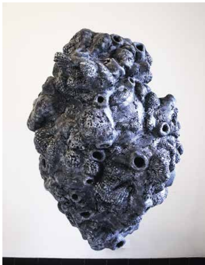
Nel Bonte, Sweet Strangler , 130 x 90 x 100 cm, mixed media, expo Beestig in Damme

om naden en kieren te dicht. Het heeft het grote voordeel van zeer licht te zijn. Ze toont op diverse plekken die sculpturen en wordt ook gevraagd door Jan Moeyaert van Stichting IJsborg in Damme voor de tentoonstelling Beestig . Daar werd het werk niet gepresenteerd op een palet zoals ze normaal doet, maar was het opgehangen en dat bleek te functioneren. Zo speelt toeval of het idee van een curator soms ook een rol.