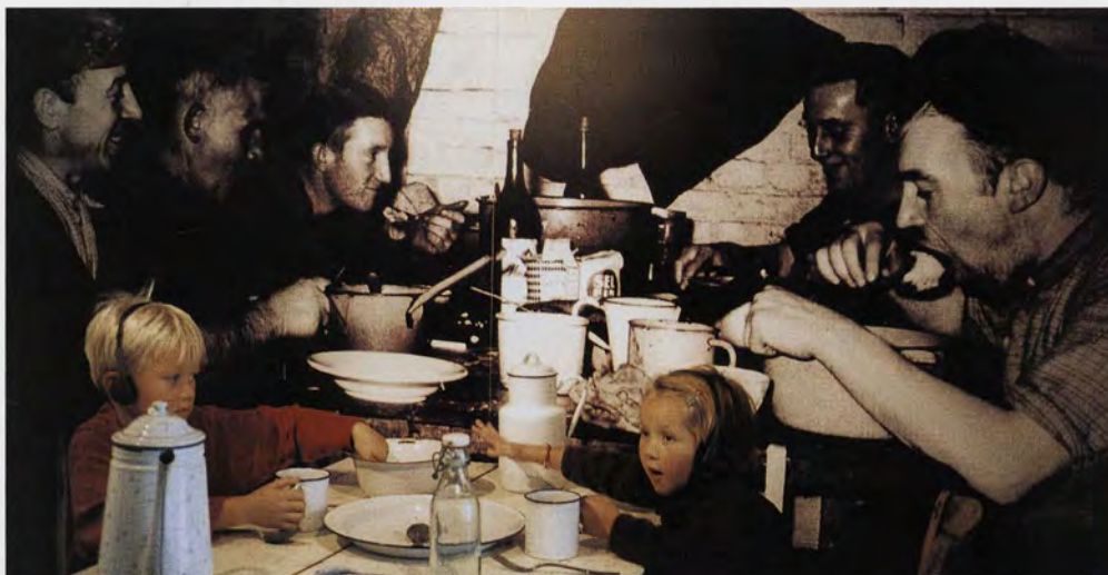
Links: Foto: Harrie Spelmans / Boven: Foto: OKV

Het museum leent zich voor een bezoek in familie- of klasverband. De kinderen volgen geboeid de animatiefilmpjes terwijl je je als volwassene op andere info kan concentreren.