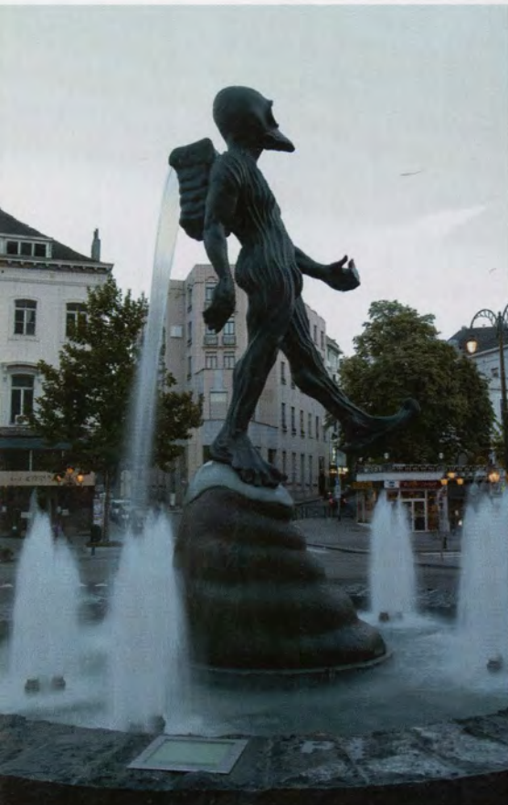
De Man van Atlantis , 2003, Brussel, Waterloolaan, 520 x 235 x 160 cm., brons

Zijn favoriete reisdoel is Rome. Het is een stad waar de cultuurlagen open en bloot op elkaar gestapeld liggen, een stad met poorten en bogen, een stad vol barokke beelden en gebouwen. De barok ligt hem nauw aan het hart en dat kan je ook in zijn beelden terugvinden. De barok geeft een momentopname, geen statische maar extatische beelden, beelden die de zwaartekracht tarten, die willen loskomen van de aarde. De kunstenaar wil in zijn beelden ook tegen de zwaarte ingaan, die druk naar beneden ontstijgen, de vrijheid voelen van de eindeloze ruimte. Het is niet toevallig dat wolken eveneens veelvuldig in zijn beelden en tekeningen naar voor komen. Is er iemand onder ons die als kind niet bij wolken heeft gefantaseerd? Hij heeft ooit een beeld gemaakt dat een tempelachtige fabriek voorstelt: op het dak staan twee rijen schoorstenen waaruit grote rookpluimen omhoog kringelen. Het is een Wolkenfabriek – l'usine aux nuages – het is zijn antwoord op de vraag: "Papa, waar komen de wolken vandaan?"