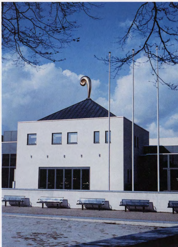
Evolutie in de orionnevel, 1995, Lommel, CC De Adelberg, 300 x 160 x 75 cm., polyester en blad goud

In een catalogus van een groepstentoonstelling in 1993 staat de kunstenaar in bloot bovenlijf afgebeeld terwijl hij, de beide armen opwaarts houdend, met een meetlat in de weer is. Toen al was hij "de man die de wolken meet".