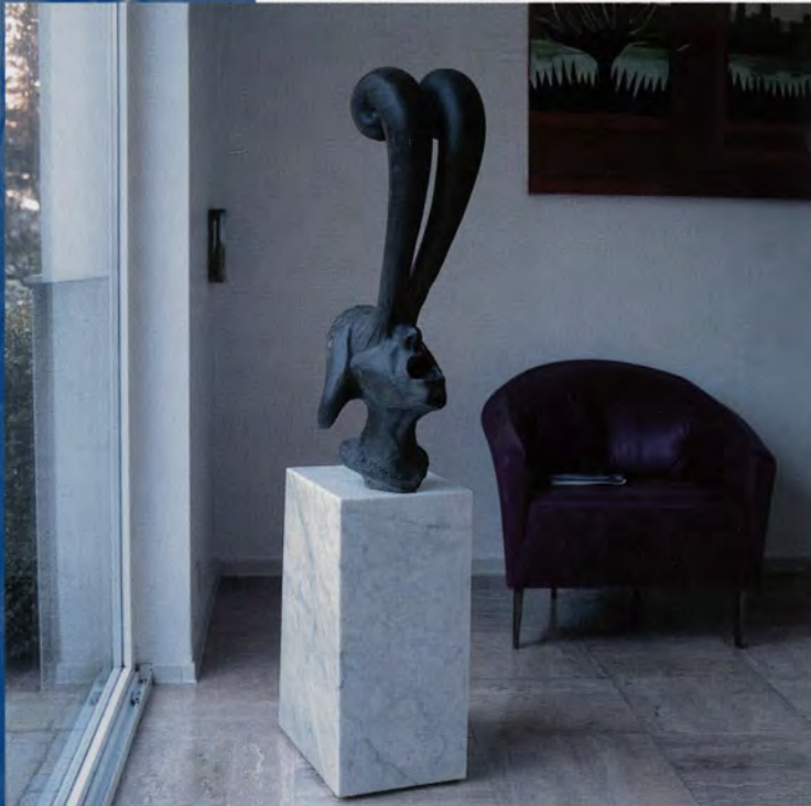
De man die de toekomst zag, 1998, 142 x 30 x 45 cm., brons en steen

Praten met Van Soom is heerlijk, ongemerkt sleept hij je mee in zijn wereld van droom én daad en voor je het goed beseft ben je mee aan het reizen.