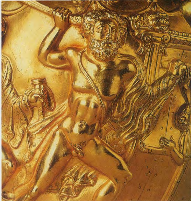
De schat van Panagyurishte (detail)