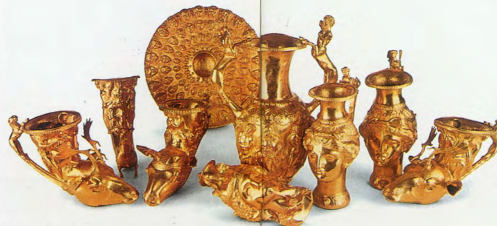
De schat van Valcitrán

De tentoonstelling opent met voorwerpen uit het Thracische Neolithicum (7000 – 6000 vC). Die zijn wél exclusief voor deze tentoonstelling. Deze artisanale productie, waaronder vele voorwerpen in aardewerk, getuigt van creativiteit en visie. De Thraciërs ontplooiden een eigen zin voor beeldende decoratie en een originele vormgeving die op geen enkele oudere bron lijkt terug te gaan. Een belangrijke plaats wordt ingenomen door talrijke, kleine, vrouwelijke idooltjes. Mogelijk is dit een verwijzing naar ene vruchtbaarheidsgodin, die het middelpunt vormde van een religieus systeem rond vruchtbaarheid en voorspoed.