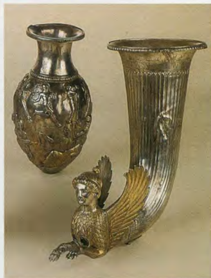
De schat van Borovo

De tentoonstelling geeft een mooi en vrij volledig overzicht. Het blijft vrij bijzonder dat dit allemaal bij elkaar te zien is. De opstelling in het Paleis voor Schone Kunsten is mooi en soms zeer sober. Maar dat komt deze voorwerpen alleen maar ten goede. Ze liggen overzichtelijk uitgesteld en zijn mooi belicht. De duiding is helder en niet overmatig, dus zeker niet storend. Leuk zijn ook de citaten op de muur, van o.a. Homeros. Eén puntje van kritiek toch. De eerste drie zaaltjes zijn mooi, maar ook heel erg smal. Hoe je hier doorheen moet als er twee of drie groepen in de zalen staan, is een compleet raadsel. Maar laat het je niet tegenhouden. De zalen die volgen zijn ruim en bieden een absoluut kijkcomfort.