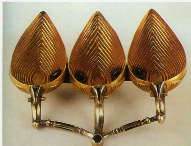
De schat van Panagyurishte

Vanaf 5500-4000 vC (het Chalcolithicum) doen er zich belangrijke evoluties voor. Naast de traditionele voorstellingen in terracotta krijgen we nu ook koperwinning en bewerking. Ook goudbewerking komt nu vaak voor. Uit deze periode zijn er een aantal zeer mooie vondsten, waarvan de schat uit de necropool van Varna. Dit in 1972 ontdekte graf werd ontdekt tijdens bouwwerken. Het bevat een uitzonderlijk ensemble van voorwerpen en juwelen in goud, 222 in totaal, voor een gewicht van 1092 gram.