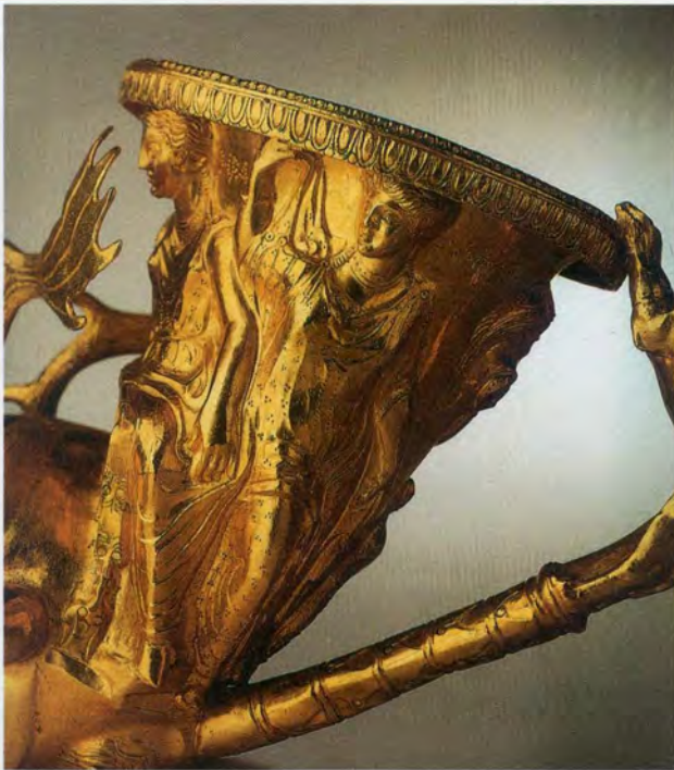
De schat van Panagyrishte (detail)