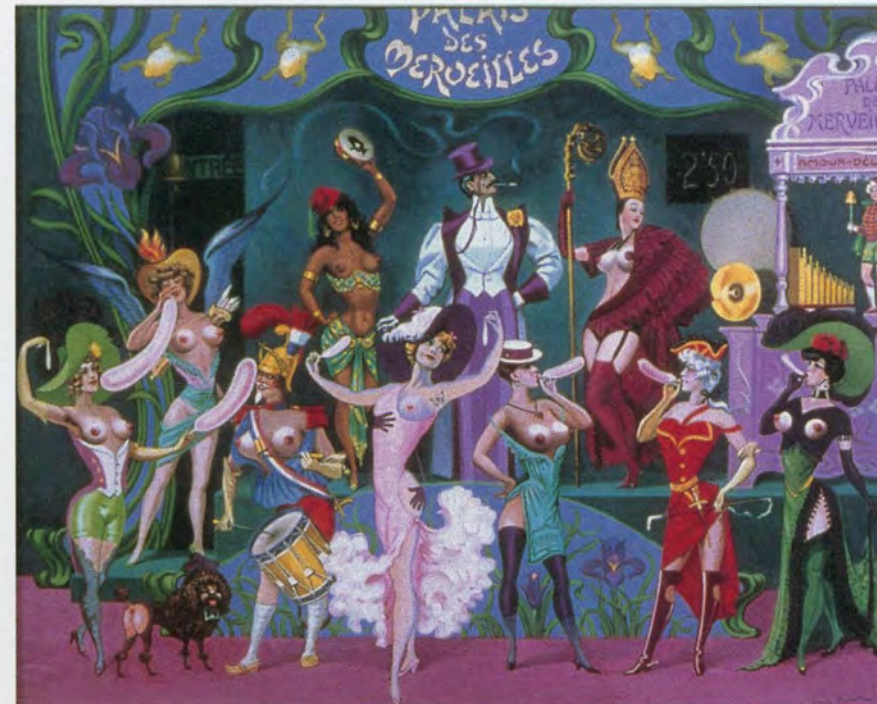
De vrolijke parade, 1907-1960