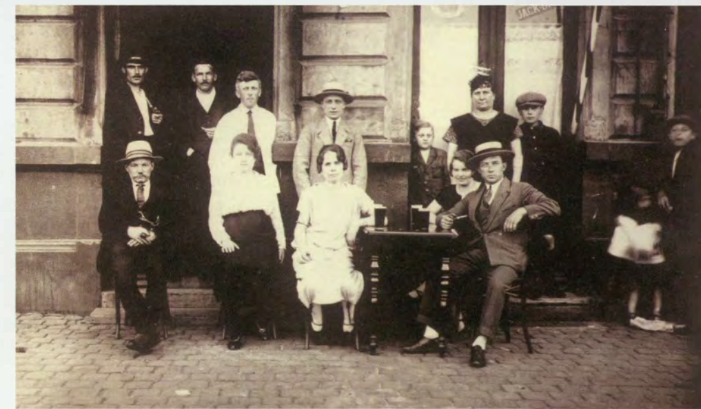
Ook toen al terrasjes in Antwerpen

Men probeert de havensfeer te vatten door de foto's en de voorwerpen te tonen