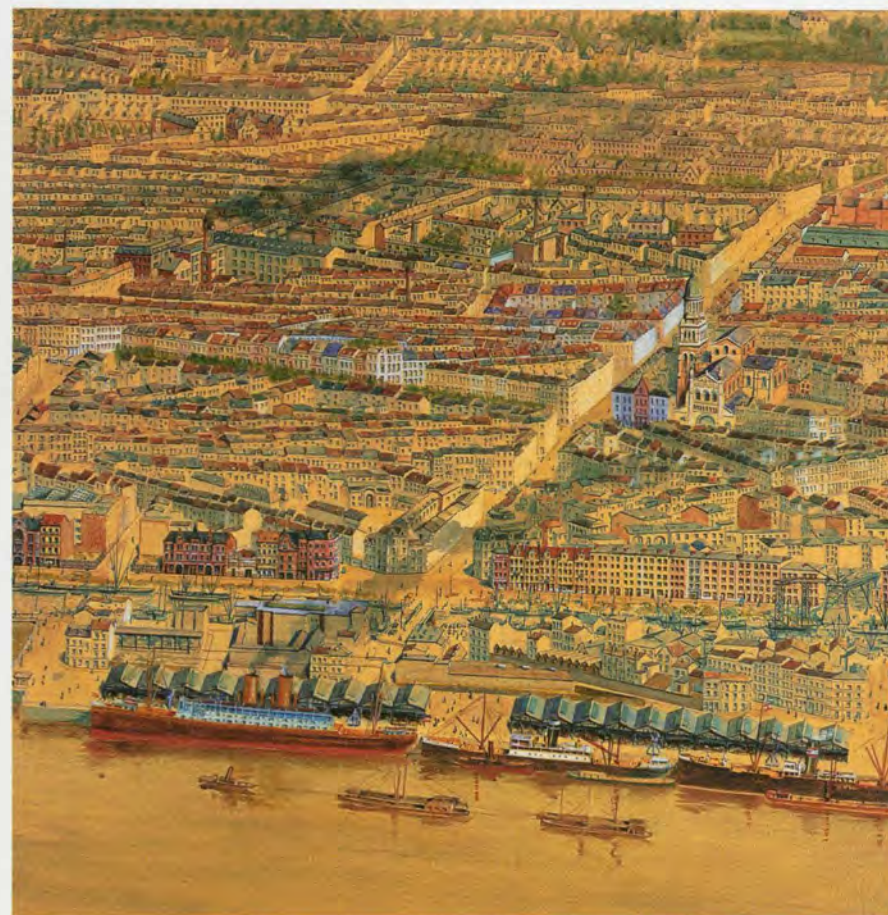
Hypsoskaart (3 maal), © Bart Huysman

in een decor van iets wat een oude houten loods of zo moet voorstellen. Zelfs een heus 'hoerenkotje' werd eraan toegevoegd. Maar wat je uit het boek wél leert, de context, haal je niet uit de tentoonstelling zelf. Het geheel oogt zeer povertjes. Zat er echt niet méér in dan 1 zaal? Bovendien is de architectuur van het volkskundemuseum zo dwingend aanwezig dat de illusie geen moment overeind blijft. Dit is geen museumzaal die geschikt is om een tentoonstelling in te bouwen. Mogelijks werkt dit decor wél in