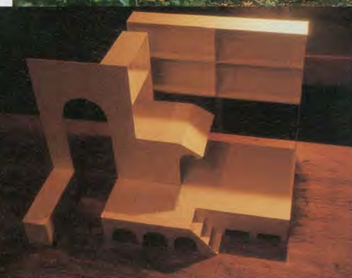
Maquette van 'Skin'

1,80 m. Er is een opening in de koker zodat je kan binnentreden. Je kan je midden in de natuur even afzonderen om diezelfde natuur door een zwarte waas te bekijken, je kan je even alleen weten zelfs al ben je voor iedereen zichtbaar en de anderen evenzeer voor jou. Het is een mentale ruimte die op een sublieme en