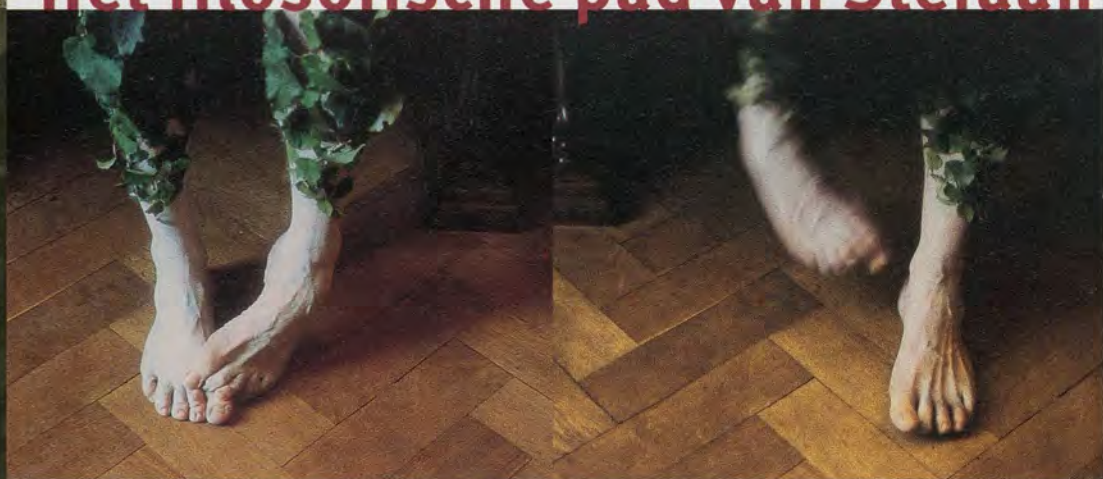
Wildeman variaties, 1997

kerk als een palazzo kan refereren. Er zijn ranke zuilen en doorkijkjes naar het landschap, maar die zijn er enkel voor de toeschouwer, niet voor de figuur die er zich teruggetrokken heeft. Hij heeft zich vrijwillig afgezonderd in een strak gestructureerde studio met eigenlijk slechts twee wanden. De studio is wat verheven boven de wereld, het is als een podium. De geleerde kerkvader leest een boek en is omringd door diverse voorwerpen. Hij bestudeert de wereld niet door rechtstreekse observatie, maar via studiemateriaal, hij bestudeert de wereld waaruit hij