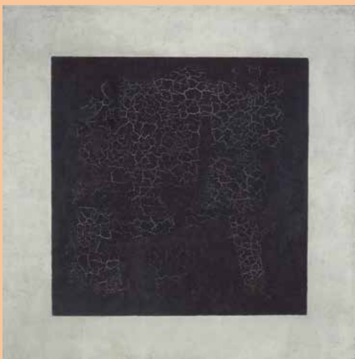
Kazimir Malevich, Zwart vierkant , 1915, olieverf op doek, 79,5 x 79,5 cm, Tretyakov_Gallery, Moskou

In het tweede hoofdstuk graaft hij in de kunsttheorie. Hoe groeide het begrip kunst en wie waren de gangmakers? De Griekse ideaal van mimesis – nabootsing van de natuur – blijft