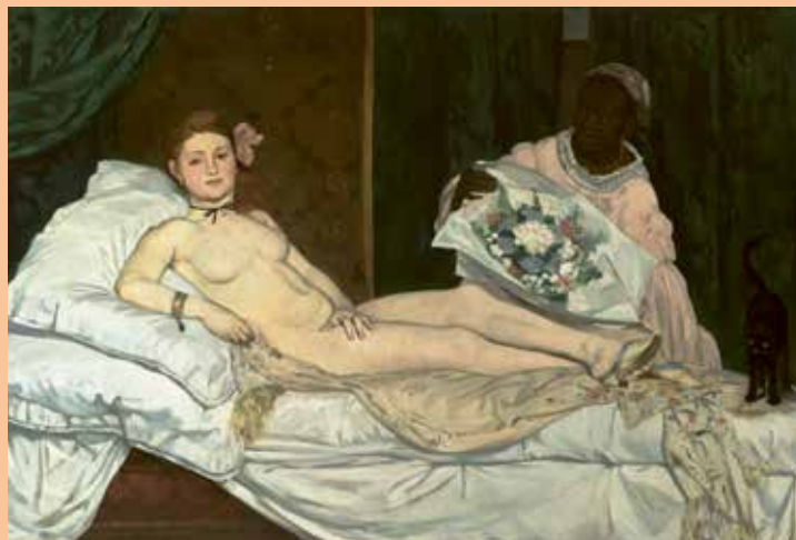
Édouard Manet, Olympia , 1863, olieverf op doek, 130,5 x 190 cm, Musée d'Orsay, Parijs

Dit boek geeft je inzicht in de redenen waarom een kunstenaar het canon heeft gehaald. De hoofdstukken zijn niet alleen invalshoeken, het zijn selectiecriteria. Hoe meer selectiecriteria