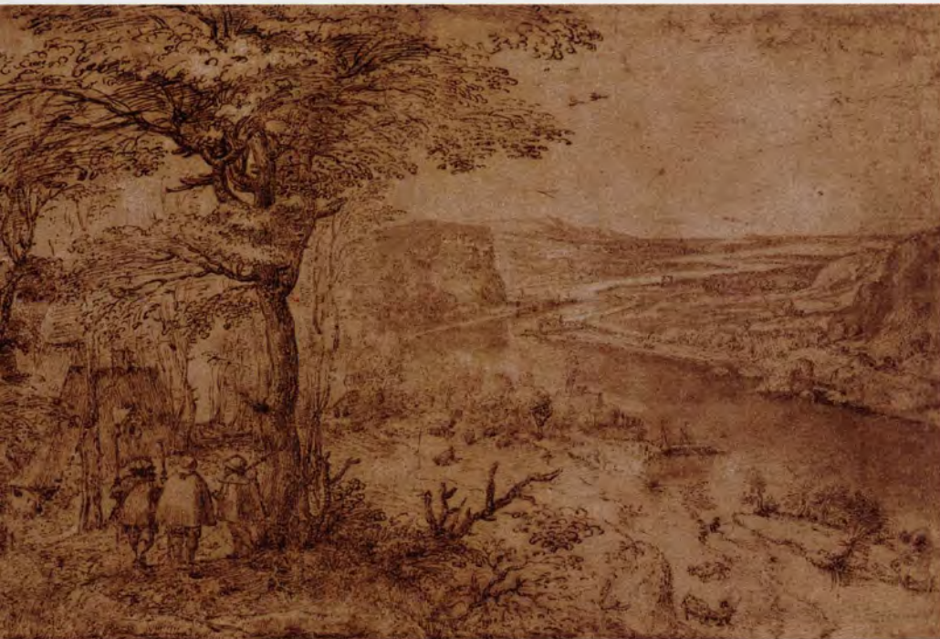
Pieter Bruegel I, Landschap met pelgrims, pentekening in bruin, deels met bister gewassen, Koninklijk Museum voor Schone Kunsten Antwerpen

wijze het leven en de liefde verheerlijkt. In snelle rake toetsen legt hij de innigheid en beweeglijkheid van zijn geliefd model vast: al snel schakelt Rik over van houtskool naar het soepele penseel en de mysterieuze diepte van het fluweelzwart van Oost-Indische inkt. De KMSKA bezit een 35-tal aquarellen waar zijn levensgezellin Nel de enige hoofdrol lijkt te spelen.