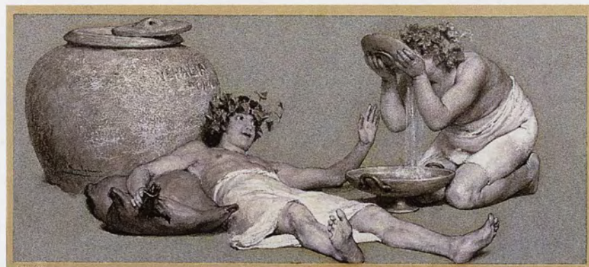
Lawrence Alma-Tadema, Nehalia Populus , aquarel en witte dekverf op grijs gespikkeld papier, Koninklijk Museum voor Schone Kunsten Antwerpen

Vele tekeningen, prenten en andere kunstwerken op papier leiden een sluimerend bestaan in laden en donkere ruimtes van de museumreserve. Zij verdragen geen licht, zijn uiterst gevoelig voor te droge of te vochtige lucht en zijn te fragiel om veel gemanipuleerd te worden. Kortom zij liggen, ook in musea, meestal ver weg van een publieke ruimte en kunnen hoofdzakelijk enkel door wetenschapsvorsers op aanvraag bekeken worden.