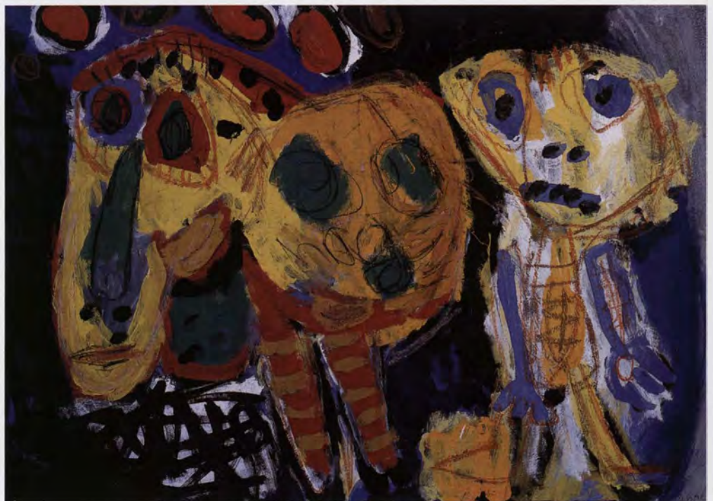
Karel Appel, Dier en kind op blauwe achtergrond, 1953, gouache, Koninklijk Museum voor Schone Kunsten Antwerpen

Tot 25 november 2005 kan het publiek mondjesmaat kennismaken met een strenge selectie van het allermooiste uit dit prentenkabinet. Omwille van conservering en behoud van deze fragiele werken op papier worden zij per dertig stuks getoond en om de vier maanden afgewisseld door een nieuwe selectie. Jammer genoeg is er geen tentoonstellingscatalogus, noch een audiogids. Maar voor de liefhebbers verwijzen wij graag naar de catalogus van tekeningen, aquarellen en prenten uit de negentiende en twintigste eeuw, uitgegeven door het KMSKA.