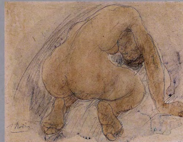
Auguste Rodin, Naakt , potlood en aquarel, Koninklijk Museum voor Schone Kunsten Antwerpen

Van James Ensor bezit het museum meer dan 600 schetsen en composities. De tekeningen onthullen vaak de 'verborgen aspecten' van zijn werkwijze: studies naar het leven, kopieën naar oude en moderne meesters (Rembrandt, Turner, Delacroix en Manet). Ensor kopieerde hoofdzakelijk van reproducties en niet naar oorspronkelijke kunstwerken en had interesse voor techniek én inhoud. Door samenvoegen van meerdere schetsen op één blad maakte hij nieuwe, vaak ironische composities. Vooral de reeks chinoiserieën, getekend in de jaren 1885-1887, zijn door het accentueren van het essentiële en de vloeiende omtreklijn de uitdrukking van een geheimzinnige wereld van demonen, tovenaars, skeletten en monsters. Ze zijn als het ware een inleiding op zijn maskertijd in de schilderkunst. In de tekeningen van Ensor is de algemene evolutie in zijn werk te ontdekken.