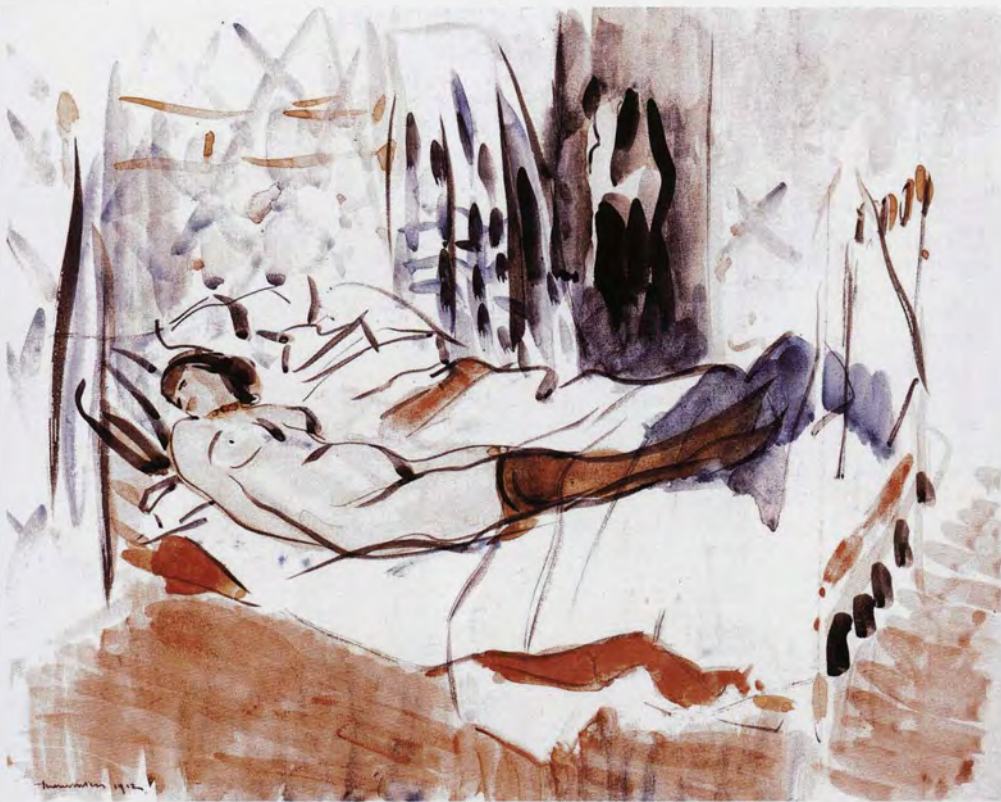
Rik Wouters, Rustende vrouw, 1912, aquarel, Koninklijk Museum voor Schone Kunsten Antwerpen

Auguste Rodin domineert de beeldhouwkunst bij de overgang van de negentiende naar de twintigste eeuw, niettegenstaande de hevige tegenstand bij de pers en het publiek. Hij creëert een gedreven realisme, verankerd in de traditie van de Grieks-Romeinse beeldhouwkunst, maar voert de dramatiek op door tegenstellingen in de pose en licht-schaduw effecten in de textuur van klei of brons te accentueren. Rodin liet een groot aantal tekeningen na die studies van houdingen en beweeglijkheid voor zijn beelden genoemd mogen worden. De KMSKA bezit zeven potlood- en aquarelstudies van vrouwelijke naakten. In enkele trefzekere potloodtrekken wordt de vaak gedurfde pose van het model in de ruimte van het blad vastgelegd. Door nadien de tekening bij te schilderen met warme waterverftinten wordt de sensualiteit van het soepele lichaam verhoogd. Sommige van deze aquarellen slaan een brug naar het Weense expressionisme van Egon Schiele en Gustav Klimt.