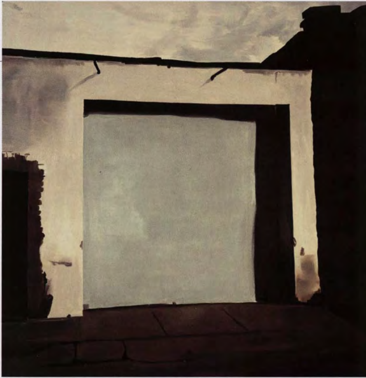
Koen van den Broek, Garage, 2002, olieverf op doek, 174 x 170 cm.