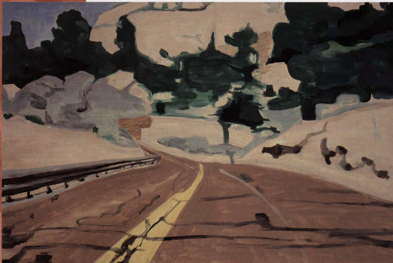
Koen van den Broek, Zion, 2002, olieverf op doek, 100 x 150 cm.

Hij bezit blijkbaar wel enige overtuigingskracht en weet zich aanvaard om verder te studeren aan het HISK (Hoger Instituut voor Schone Kunsten) dat een broeinest is van interessante figuren en coming people .