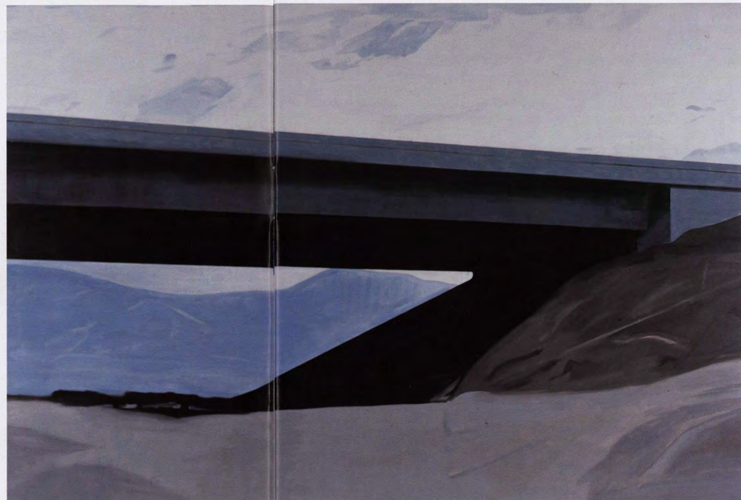
Koen van den Broek, Viaduct , 2002, olieverf op doek, 280 x 420 cm.

kunstenaar die ik onder de groten reken – enkele jaren geleden Koen van den Broek aan het lezerspubliek van De Morgen heeft aanbevolen.