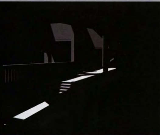
Een gebouw, een gevoel, een sfeer Building , 2003 © Anouk De Clercq

Tsjernobil vormde het uitgangspunt van de video. De idee dat er een plek is waar een ramp ineens alles doet stilstaan greep me aan. Schriften en pennen bleven na de ramp roerloos liggen in de klaslokalen. De plaats is gevuld met dreiging en gevaar, genoteerd door geigertellers. Je hoort hoe de muziek het beeld opjaagt maar in geen geval er een illustratie van wil zijn.”