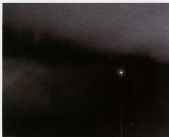
Conductor, 2004