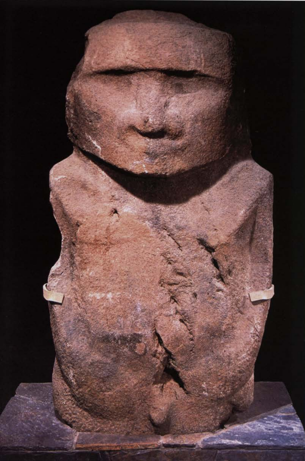
Pou Hakanononga nu in het KMKG te Brussel

Toch is men het er ondertussen wel over eens dat de bevolking die de stenen beelden bouwde, niet uit de hemel kwam neergedaald, noch van Latijns-Amerikaanse afkomst was, zoals Thor Heyerdahl nog beweerde, maar wel van Polynesiëse origine. Over het precieze moment van hun overkomst is minder zekerheid: meestal wordt het jaar 400 vooropgesteld. "Men heeft houtskool gevonden die men