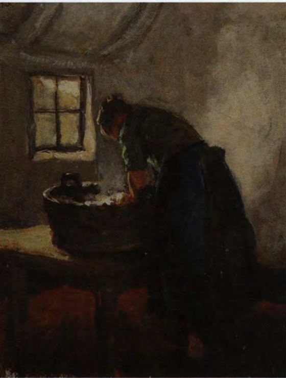
Jakob Smits, Vrouw aan de wastobbe, 1886, olie op paneel, 41 x 33 cm

er bruiklenen. Op die manier kan men ook kennismaken met alle technieken die Smits heeft aangewend.