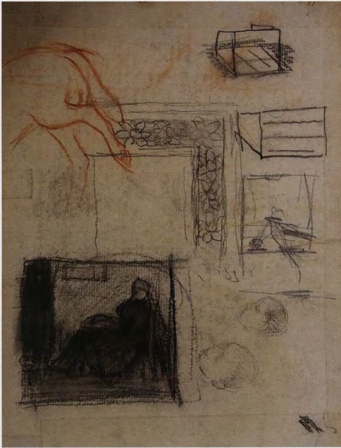
Jakob Smits, schetsen op binnenzijden van schetsboeken, [zd], zwart en rood krijt, 25,5 x 19,5 cm