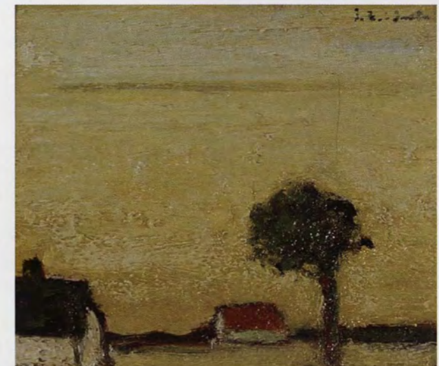
Jakob Smits, Kempens landschap , 1927 olie op doek, 93 x 97,5 cm