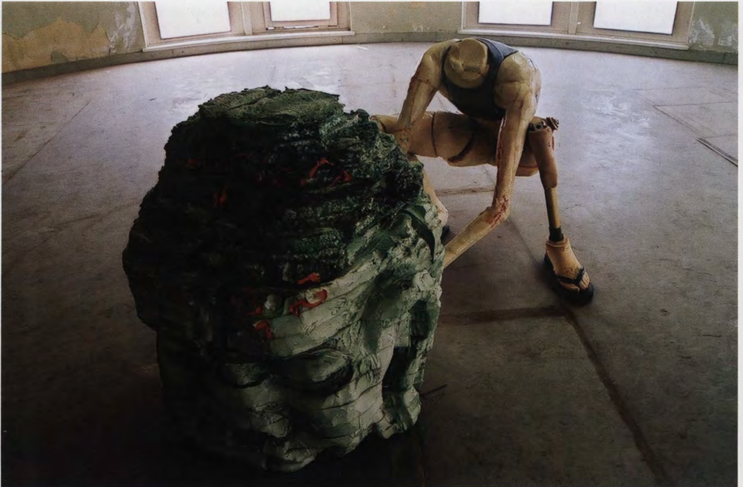
Een krachtig statement Bart Van Dijck, Khmer Sculpture, 2002 Mixed media, 68 x 200 x 100

Bijzonder aangrijpend en beklijvend zijn de tekeningen die hij bij tientallen maakt als voorstudie of als dagboeknotities, en gewoonweg meesterlijk zijn de uitgewerkte versies die hij aan het publiek presenteert.