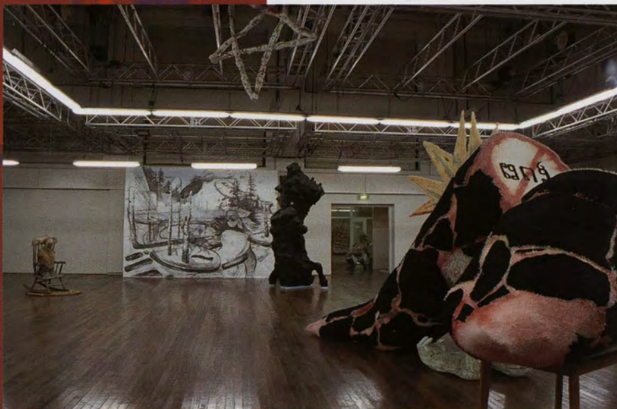
Werken in functie van de locatie Tentoonstelling Placenta 5 in de Brakke Grond Amsterdam, november en december 2003

Haar werk is zeer polymorf, het vermengt plantaardige en dierlijke vormen, wat tot bevreemdende maar herkenbare resultaten leidt. Ze is erg geïnteresseerd in landelijke culturen en vertoeft af en toe in agrarische gemeenschappen in landen als Roemenië en Polen. De creativiteit van die culturen die uit armoede met bric à brac bouwsels optrekken, zoals we dat ook soms in vroegere Vlaamse achtertuinen konden bewonderen, heeft op haar een inspirerende werking. De letterlijke gelaagdheid in de materialen is er ook één in de betekenissen.