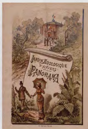
Het panorama in de dierentuin, afgebeeld op een menukaart van het banket ter ere van schilder Alfred Cluysenaer op 13 augustus 1881

Op 16 juli 1881 opende het panorama Antwerpen in de XVIde eeuw , als eerste van de drie die dat jaar in de stad opgericht werden. Het was een initiatief van de in 1880 in Brussel opgerichte Société Anonyme des panoramas des artistes Belges . De marine-schilder Louis Artan leverde het ontwerp, dat door anderen uitgewerkt werd tot een enorm doek met een diameter van 36 meter en een hoogte van 12 meter. Datzelfde jaar zouden in Antwerpen nog twee panoramarotondes hun deuren openen. Op de hoek van de De Keyserlei en de Frankrijklei stond het panorama van Waterloo, geschilderd door Charles Verlat. In de dierentuin vestigde zich het panorama met de slag van Wörth, van de hand van Alfred Cluysenaer.