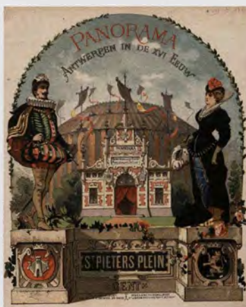
De panoramarotonde Antwerpen in de XVIde eeuw Chromolitho, circa 1882 Universiteit Gent, Centrale bibliotheek

Dat ook Antwerpen een rol heeft gespeeld in deze geschiedenis van optische illusies, is zo goed als onbekend. Er bestaan weliswaar geen monumentale relictten van Antwerpse panorama's, maar geduldig speurwerk van de auteurs leverde stof op voor een boeiend verhaal.