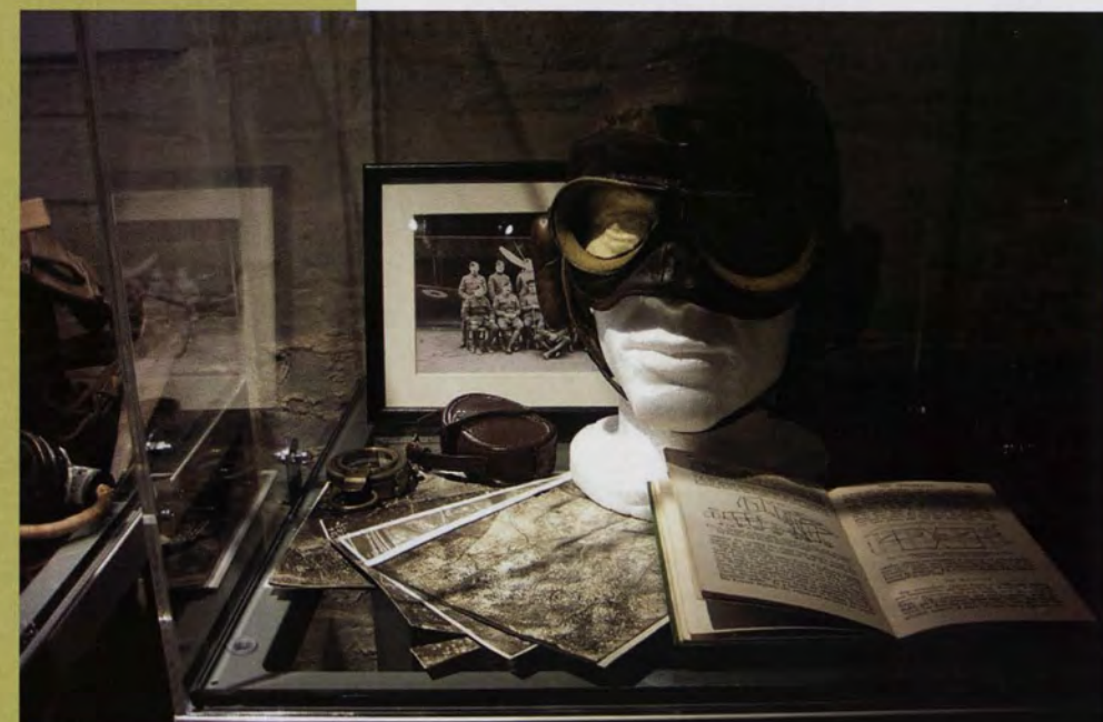
Herinneringen aan de Grote Oorlog

De eerste verdieping van het hophmagazijn werd ingenieus omgebouwd tot een 'Concert Hall'. Er werd een artistiek directeur aangesteld, en er was een vast huisorkest. Avond na avond stond een grote waaier aan activiteiten op het programma. In de winter