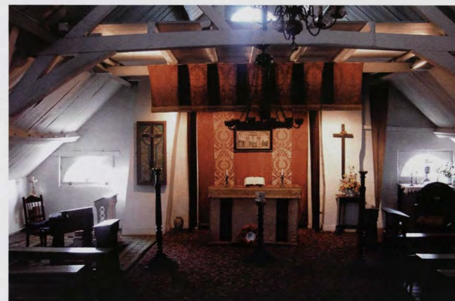
De zolderkapel in Talbot House was al snel te klein