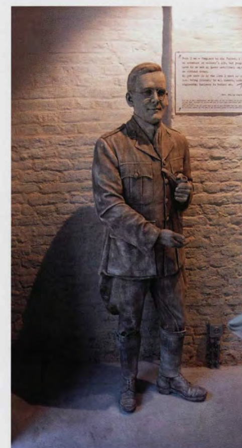
Philip 'Tubby' Clayton: een opmerkelijke aalmoezenier

Al gauw groeide Toc H uit tot soldatenhuis waar een bont gezelschap van Brits-koloniale gasten vertoefde. Chaerle: "Ook Chinezen zijn in Talbot House geweest." In het kleurrijke Talbot House viel altijd wel iets te beleven, er hing een onbeschrijfelijk thuis-