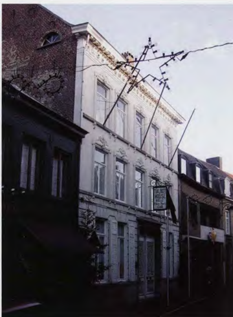
Talbot House: veel van de oorspronkelijke sfeer bleef bewaard

Daartussen probeerde de lokale bevolking te overleven door handel te drijven, een koffiehuisje te openen, of te gaan werken in dienst van het leger. Al snel werd Poperinge omgedoopt tot 'Little Paris' en 'Klein Soho'. De gelijkvloerse verdieping van het hoptagazijn schetst een beeld van dit leven achter het front in onbezet gebied. Hier wordt het brede verhaal opgehangen van de soldaten in de rustkampen, de medische zorg in de