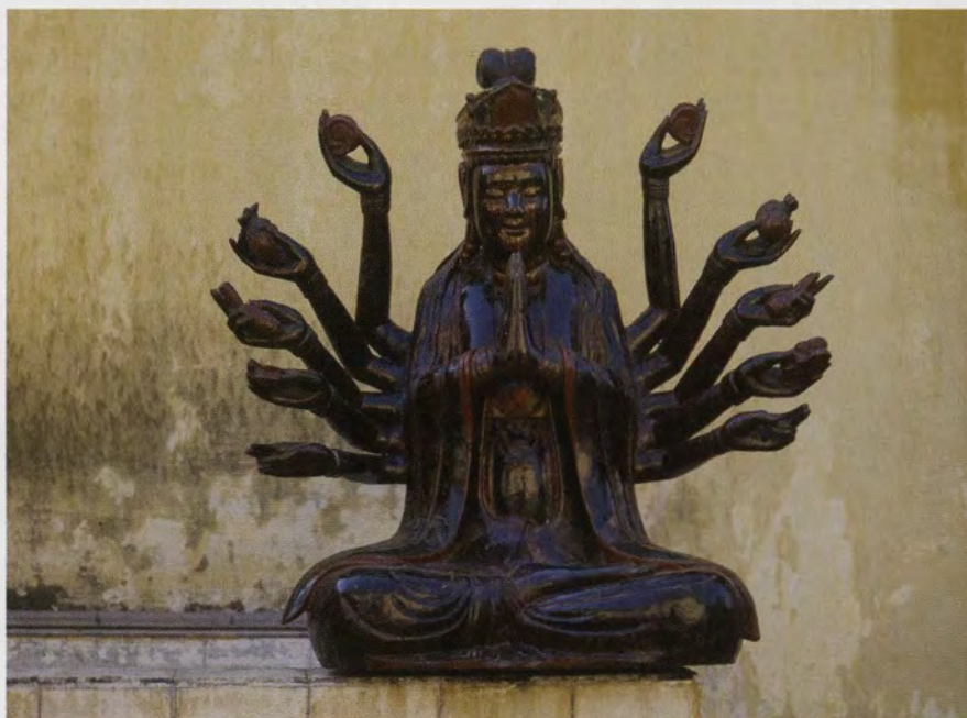
Avalokitesvara, boeddhistische godheid, Noord-Viëtnam, 18de eeuw, gelakt hout, Museum voor Schone Kunsten Ho Chi Minh Stad

In de omgeving van Hanoi wordt door museummedewerkers, in samenwerking met