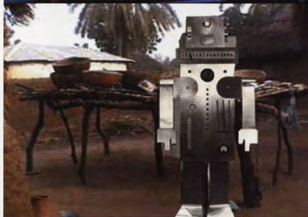
SUE WILLIAMSON, CAN'T FORGET, CAN'T REMEMBER, 2001, © OLOF WALLAGREN