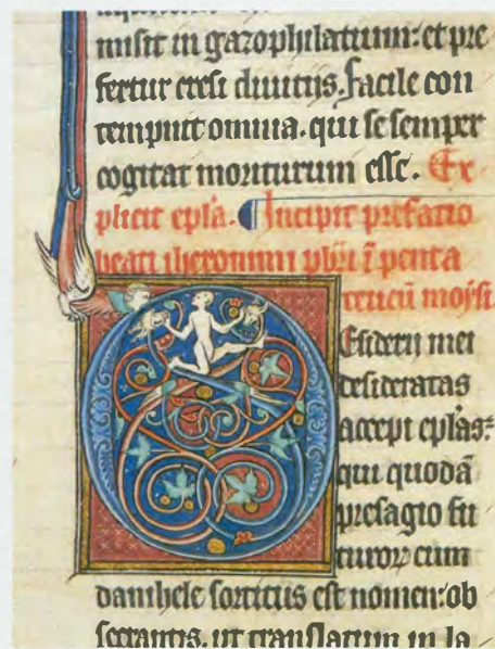
Bijbel van Ter Doest, Oud Testament, 13de eeuw