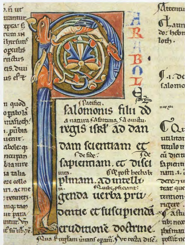
Initiaal, Bijbel, Oude Testament ca. 1200

..... BESLOTEN WERELD, OPEN BOEKEN Nog tot 17 november 2002 Grootseminarie Potterierei 60 8000 Brugge