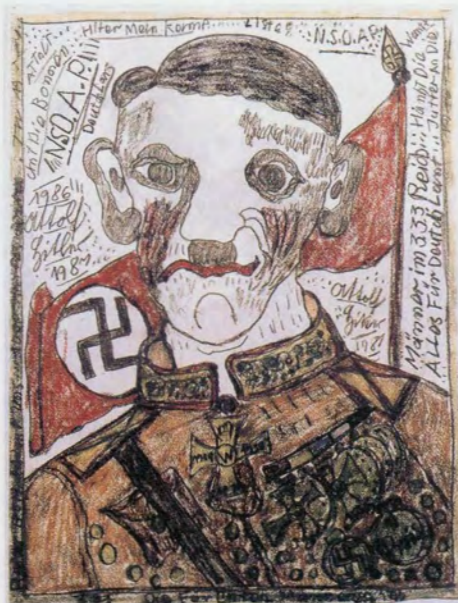
'Hitler', Theo, Stichting Collectie De Stadshof

De levensverhalen van de kunstenaars zijn vaak schrijnend en grijpen je rechtstreeks naar de keel. Hoe uit zoveel ellende soms zoveel moois kan geboren worden. Je begrijpt het als toeschouwer vaak niet. Maar is wat we niet begrijpen nu net niet zoveel intrigerender dan de rest? Bij deze werken horen geen grote theorieën, geen grote verhalen. Het zijn getuigen van een leven dat anders verliep dan dat van de meesten van ons. Het zijn vensters die ons een blik gunnen in het hoofd van mensen die door de maatschappij vaak als 'minder' worden aanzien. Het is een blik in een wereld zonder grenzen. Alles kan en alles heeft zijn eigen aparte logica. Wie bereid is de stap naar die wereld te zetten heeft meteen ook door dat er geen enkele grens hoeft te bestaan tussen Outsider en Insider (de gevestigde) kunst.