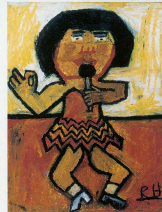
'Zonder Titel', Roel Heymans, Stichting Collectie De Stadshof

I k houd niet van het woord 'kunstenaar', God alleen bracht mij er toe dit te doen. Ik wist helemaal niet dat mensen dit wilden zien. Ik maakte het enkel voor mijn eigen plezier. Nek Chand