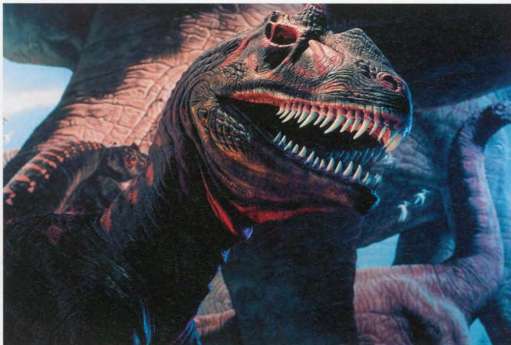
Dino's in olle moten en gewichten

Twee trappen rond een dubbele DNA helix brengen ons naar de verschillende verdiepingen. Op de eerste verdieping staan we ter hoogte van de kop van de eerder beschreven Iguanodonts. Hier zien we nog enkele skeletten van dinosauriërs voor een geschilderde achtergrond die op de grond vervolledigd wordt met rotspartijen, zand en gras. In een gang waar enkele zoogdieren en