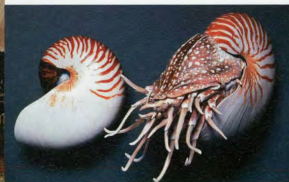
Het leven in de oceanen, in al zijn pracht

Met een verhaal over "Spino Dino" trekken we naar de cafetaria die ik persoonlijk niet echt gezellig noem.