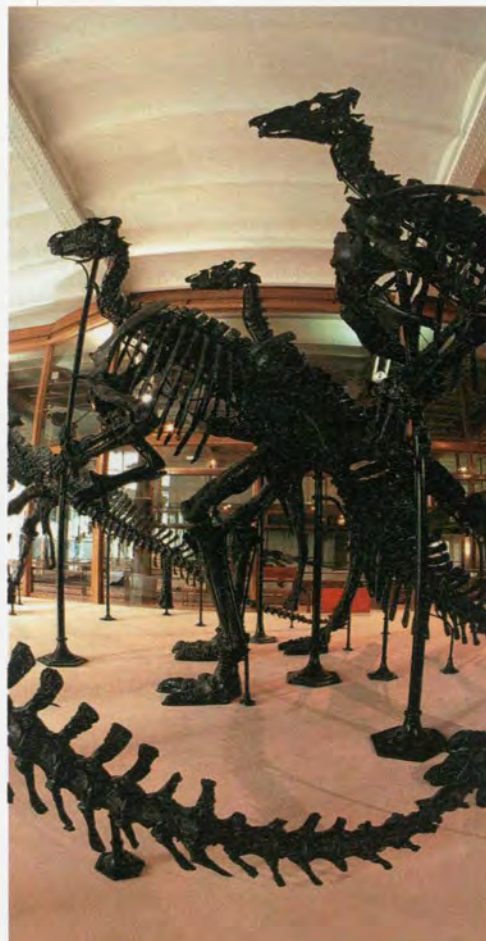
Publiekstrekking n°1 de Iguanodons, © KBIN