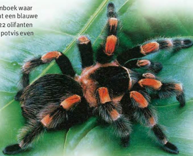
Was deze echt spoorloos?

Toch een beetje bezorgd want in één kast hebben we de vogelspin niet gezien, dalen we de trappen af en komen zo bij de uitgang.